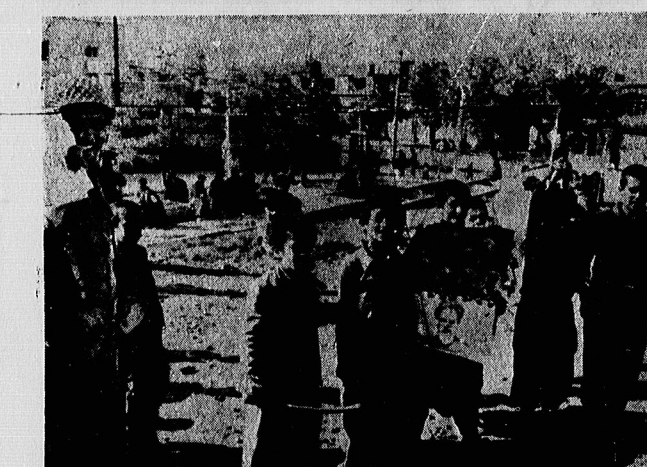
نوجوانان کرد در شهر سنج عکس رهبر انقلاب اسلامی خود را حمل می‌کنند: زمان سازندگی کردستان فرار سیاست

حمل ۱۶ تن مواد مخدانی به سنج در ۶ نقطه سنج فر و شگاههای تعاونی اسلامی دایر میشود