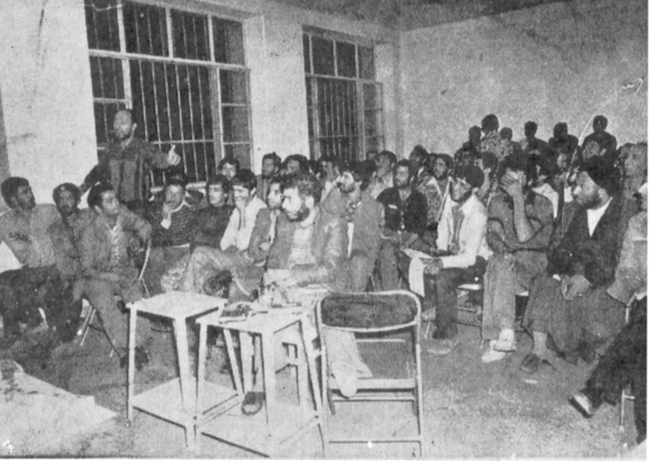
یکی از شبود علیه سرهنگ توانا فرمانده منطقه شرق فرمانداری نظامی تهران که عامل کشتار روز ۲۱ بهمن بود ، در جلسه دادگاه شهادت میدهد که بخاطر داری من اسلحه را از دست تو گرفتم ؟

توضیح حاج سید جلال آهنجیان آنجا که عیان است چه حاجت به بیان است شرح در صفحه سوم