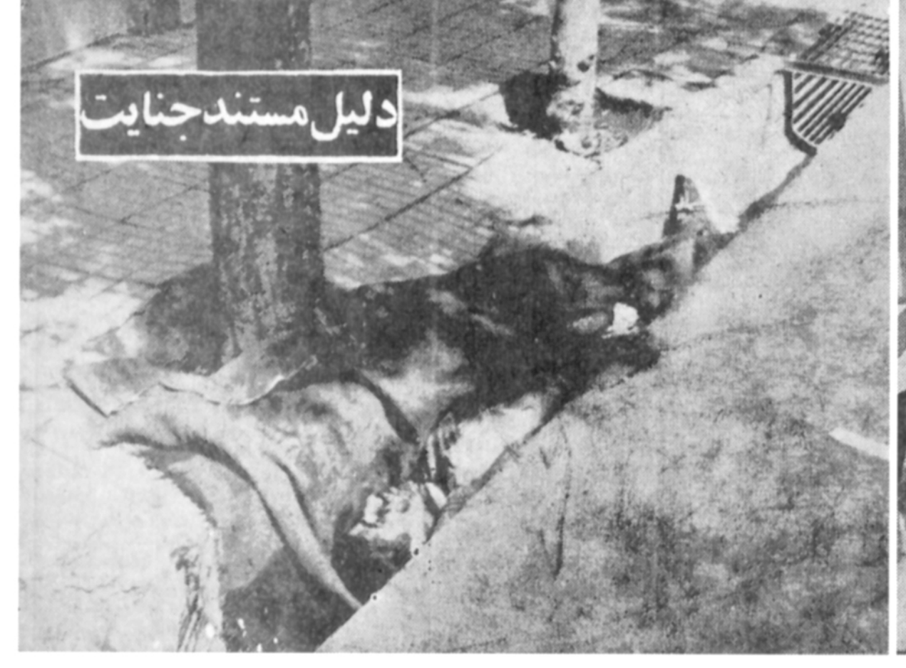
عکس بالا يك شهید ، از شهدائی است که توسط سرهنگ معدوم توانا در آنروز و در همان منطقه بقتل رسید .