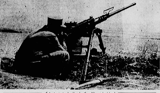
برای پایان دادن به غائله عراق، باید دفاع را به تعرض تبدیل کرد.