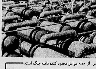
اسباب پذیر بودن منابع و تأسیسات نفتی خلیج فارس، از جمله عوامل محدود کننده دامنه جنگ است.

با توجه به چنین واقعیتی روشنی است که امید اینکه کشورهای اروپایی و آسیایی، مادن دو قدرت بزرگ بین المللی، در این مرحله مستقیم امریکا به ایران در فشار بر علیه عراق نیست. زیرا امریکا در برابر اوست ساکت نخواهد نشست. بعلاوه معلوم نیست اگر امریکا در چنین شرایطی به تجاوز مستقیم به خاک ایران اقدام کند، عیناً عکس العمل ایران در خلیج فارس کارا را به مرحله قطع صدور نفت تادمی طولانی نکشاند. از اینها گذشته دخالت نظامی مستقیم امریکا برای نجات عراق، و نجات طبرستان قبلی ارض علیه ایران، معلوم نیست که بیک جنگ تمام عری و سپس جنب جهانی سوم منتهی نگردد.