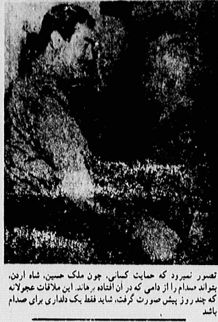
تصور نموده که حمایت کنونی، چون ملک حسین، شاه اردن، بتواند صدام را از دامی که در آن افتاده برهانند. ملاقات عجلانه که چند روز پیش صورت گرفت، شاید فقط یک دلداری برای صدام باشد