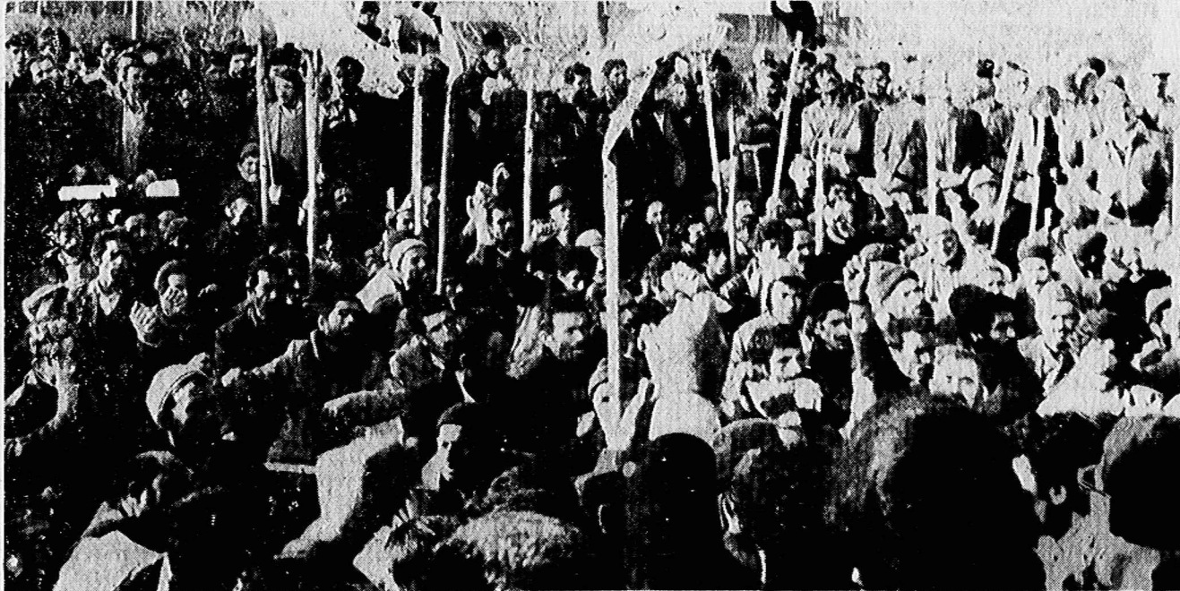
یکی از پلاکاردها:

مبارزه با فئودالیسم جدا از مبارزه با امپریالیسم نیست