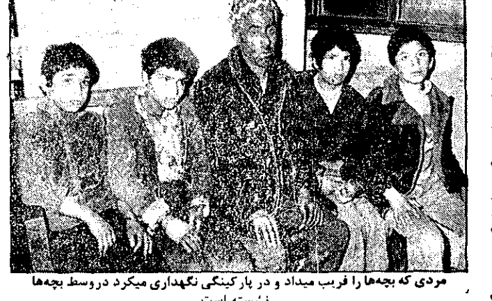
مردی که بچه‌ها را فریب میداد و در پارکینگ نگهداری میکرد در وسط بچه‌ها نشسته است