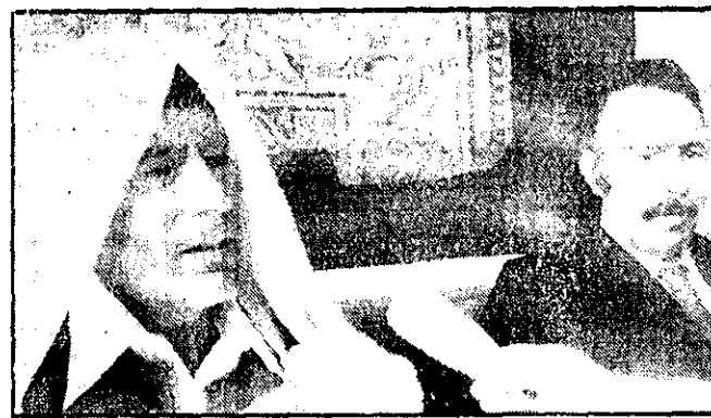
سرهنک مسمر قذافی، رهبر لیبی، بهنگام ورود به الجزیره در یک کنفرانس مطبوعاتی شرکت کرد که در آن پسرزیدنت الجزیره رئیس جمهوری داشت.

سران مخالف سادات یک فرماده می عالی سیاسی و نظامی تشکیل میدهند