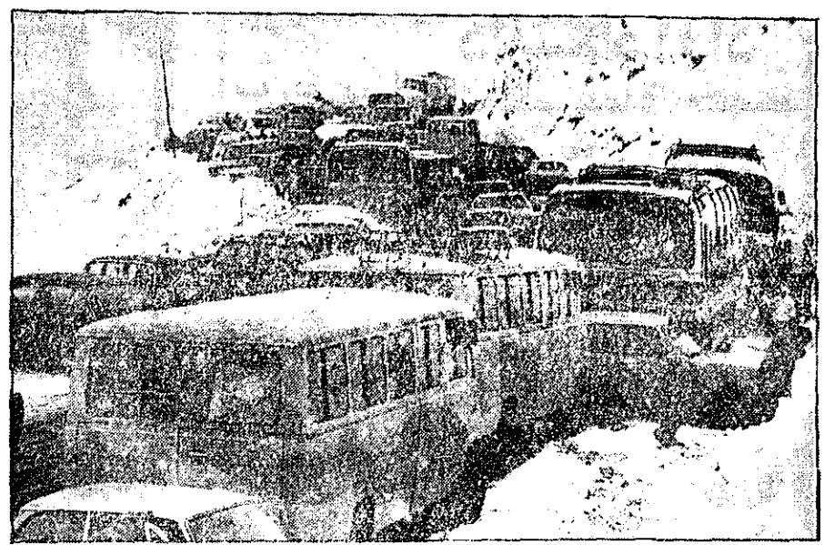
هزاران اسکی باز به دیزین فرسیدند

گازری در حال حاضر از نظر ساعت رسمی ایران از اول اسفند ۱۳۴۶ به وقت سابق برگردد. این تغییر ساعت به موجب حکم هیأت وزیران و قرار شده است. گازری در حال حاضر از نظر ساعت رسمی ایران از اول اسفند ۱۳۴۶ به وقت سابق برگردد. این تغییر ساعت به موجب حکم هیأت وزیران و قرار شده است.