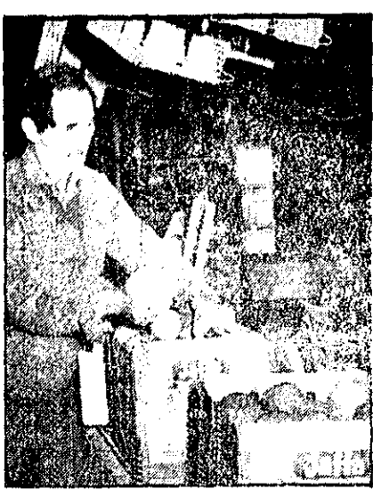
کارگری برتقال‌های اسرائیلی را که برای صدور در جعبه می‌شوند واری می‌کند، پس از پیدا کردن چند برتقال اسرائیلی مسموم در اروپا، صدور مرکبات اسرائیلی برای واری متوقف شده است.

تا این لحظه اجزای بیانیه نهایی کنفرانس اطلاعی در دست نیست، اما برپیش در منابع فلسطینی در دمشق گفته می‌شود که تجدید فعالیت باگام‌های نظامی فلسطینی در سوریه یکی از مسائلی است که در اجتماع الجزیره مورد بحث قرار می‌گیرد. این موضوع یکی از نکات «برنامه هماهنگی سوریه و فلسطین» است که مورد توافق دو طرف قرار گرفته است.