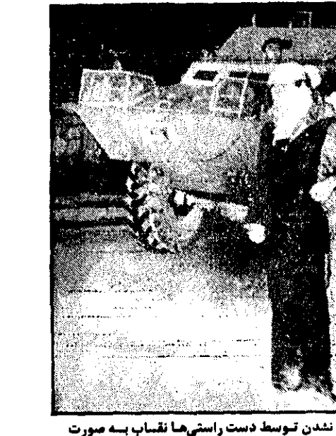
دانشجویان دست‌چینی استانبول، در حالیکه برای شناخته شدن توسط دست راستی‌ها نصاب به صورت دارند، در تظاهراتی علیه رخنه دست راستی‌های افراطی به دانشگاه‌های ترکیه دیده میشوند. در یک صحنه گذشته ۵۱ نفر در ترکیه بر اثر برخورد های دانشجویی کشته شدند. (رادپوتی یونایتدپرس)

اسوشیتدپرس - یک مرکز پزشکی امریکا دیروز اعلام داشت که انقلابیون و سینه‌پهلو در هفته گذشته ۸۶۵ نفر را در امریکا کشته است. این مقدار ۶۶ درصد بیشتر از میزان عادی تلفات بیماری‌های فوق در این مرحله از سال است.