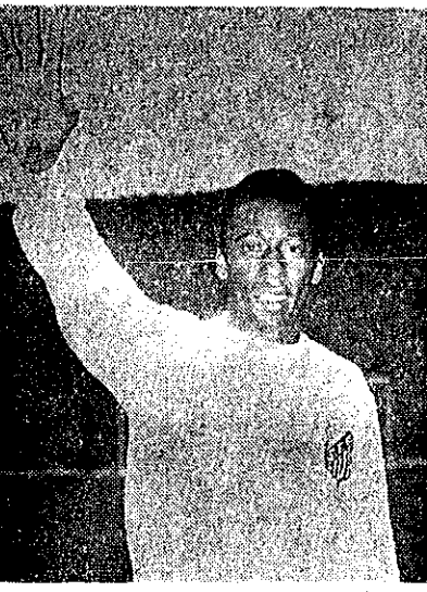
مربی فوتبال میشود به له در ایران

تیمهای فوتبال شرکت خواهند کرد. در این فیلم همچنین آمونته خواهد شد که چگونه باید امتداد و آمادگی یک داوطلب برای فویتال تشخیص داده شود و اردوهای فویتال را باید با چه برنامه ای ترتیب داد و چگونه تیمها را انتخاب کرد.