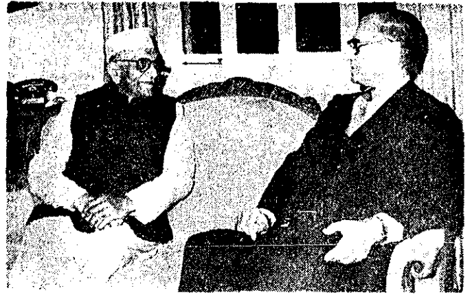
در نخستین روز دیدار دو روزی در تهران، آقایان... دوای نخست وزیر هند در استیلا... حضور یافت و با معطله... مختص انجام داد.

آئین نیایش ۱۵ بهمن، درسراسر کشور برگزار شد