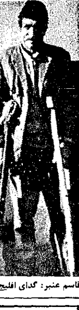
قاصد معتبر: گدای افلیج نما

شیراز - خبرنگار کیهان - گدای ۳۵ ساله‌ای که از دوپایه بسود در اداره آگاهی شیراز شفا یافت. این مرد که قاصد معتبر نام دارد، در حالیکه دوپایه زین بل داشت و در هیئت گسدهای حرفه‌ای، سردم را سرکسیه میکرد مورد نظر مأموران آگاهی شیراز قرار گرفت. مأموران، وقتی قاصد را به اداره آگاهی بردند نیز دست از لجاجت برداشتند و همچنان مدعی بودند که از دوپایه افلیج است. اما وقتی متوجه شد که رازش افلیج شده است، چوبها را کنار در آورده و به گدایی پرداخت. در اسامد روزنامه از این راه رسیدن مأموران متوجه موضوع شدند و مرا دستگیر کردند.