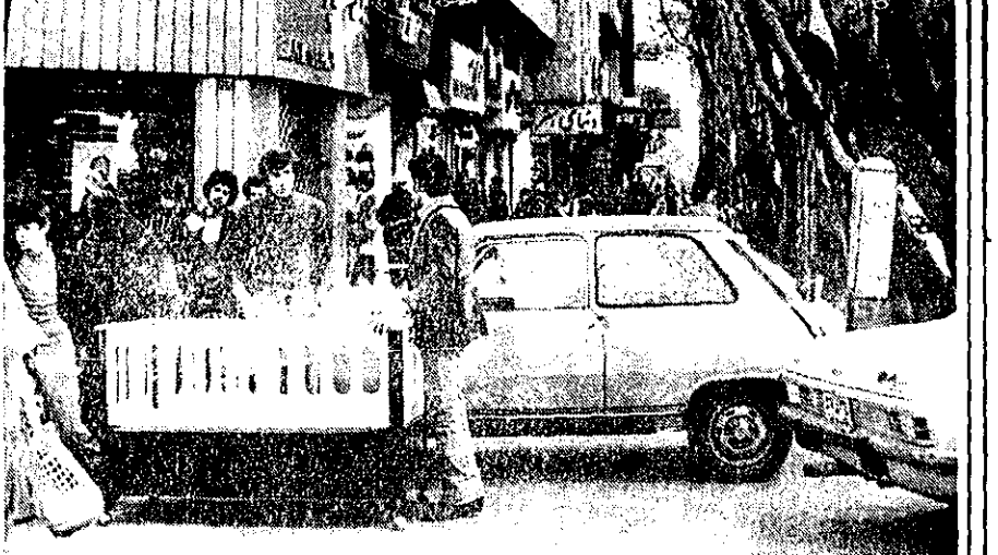
تهران، فرمان نظامی - آدم باید خیلی شجاع باشد که پیاده روی خیابان پهلوی و نیمی از دهنه خیابانی دیگر را، اینچون رک و راست ببیند و انتخاب شود.

اسامی ۹۶ نفر از کسانی که طی ۳ ماهه اخیر با تظاهرات، تظاهرات، اختلال در نظم، تخریب و غیره در تظاهرات دانشجو، معلم و افرادی که در تظاهرات دستگیر شده اند اعلام شد.