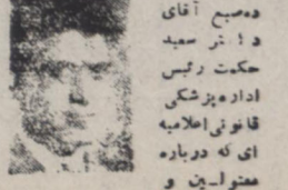
امروز ساعت ده صبح آقای دکتر رئیس اداره پزشکی قانونی اعلامیه ای که در باره مقتولین و مجروحین وانه ۲۸ مرداد صادر کرد و پرورد اختیار خبرنگاران گذاشت .

امروز رئیس اداره پزشکی قانونی اعلامیه ای که در باره مقتولین و مجروحین حادثه ۲۸ مرداد اتلاهییه صادر کرد در حادثه ۲۸ مرداد ۴۱ نفر مقتول و ۷۵ نفر مجروح شده اند و عده ای نیز که جراحتشان مختصر بود پس از پاسما مرخص شده اند بوجوب این اعلامیه در حادثه مزبور ۴۱ نفر مقتول و از این عده هوبت ۲۴ نفر معلوم گردیده و ۱۷ نفر معلوم مجروحان بوده هستند تعداد مجروحین دو کلیه بیمارستانها در تاریخ ۲۶ و ۲۷ و ۲۸ بالغ بر ۷۵ نفر بوده است و سداد دیگری نیز به جراحات جزئی داشته اند پاسمان شده و مرخص گردیده اند از کلیه مقتولین نیز عکس برهاری شده است . بقیه در صفحه دوم