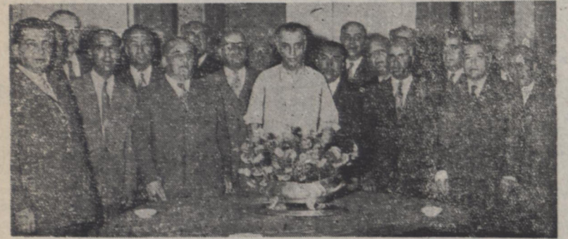
آقای سر لشکر زاهدی نخست وزیر در میان عده ای از بازرگانان در ملاقات روز گذشته ساعت شش و نیم بعد از ظهر دیروز آقایان نمایندگان بازرگانان پس از شرفیابی بحضور ماوکانه در کاخ وزارت امور خارجه با آقای نخست وزیر ملاقات کردند . در این ملاقات آقایان نیکبخت و شرابی مطالبی در باره شروع اقدامات اقتصادی دولت ونوسه کشاورزی وصنعت اظهار داشتند. سپس آقای نخست وزیر پس از تشکر از بازرگانان خوشگردد که برای رفع مضرت و مشکلات اقتصادی با مقامات اقتصادی کشور همکاری کنند.

نخست وزیر امروز در مصاحبه با خبرنگار یونایتد پرس گفت: ملک دوست باید بوضع بحرانی ما توجه کند و کمکی را که از دوستان میتوان ترقم داشت بما بنماید قسمتی از نصیبت دولت گذشته تا با قانون اساسی مناسبت داشته باشد خود بخود ملش است دولت کوشش خواهد کرد بزودی نفت ایران بدنیای جاری گردد هر گونه مذاکره در باره موضوع غرامات شرکت سابق نفت باید مطابق قوانین جاری ایران باشد - سعی خواهد شد مردم امور کشور را بدست خودشان اداره کنند