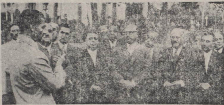
شاهنشاه هنگامی که خطاب به آقایان بازرگانان در شرف قیامی دیروز بیاناتی ایراد میفرمایند ساعت همدواز ظهر دیروز آقایان اعضای سابق اتاق بازرگانی و شورای عالی اتحادیه بازرگانان در خاگانه سده آباد به پیشگاه اعلیحضرت همایونی شرفیاب شدند .