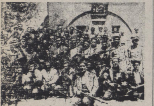
اجتمع عده ای از عشاری سنکسر در مقابل باشگاه اداره ژاندارمری بطوریکه قیلا اطلاع داده شد دهر ادر از عشاری سنکسری روز ۲۸ مرداد برای کیک به نیروی انتضای کردند دیروز صبح هشتر مزبور در تهران از سنجان برهبری آقای سرهنگ

میکردند میرفت و بیستون آنها توجه امروز هم هر تازم واردی که قدم میکرد مشاهده می نمود که حتو کنکری در سرسرای مجلس میکشاد و بسراغ آنها پیرامون چگونگی تشکیل مجدد نمایندگانیکه در عمارت پارلمان اجتمع دیروز عشاری سنکسری در اداره ژاندارمری اجتمع کردند فرمانده ژاندارمری نطق مهیجی ایراد کرد و مراحمه شاه را نا بها ابلاغ کرد امروز صبح هشتر مزبور تهران را ترک کردند