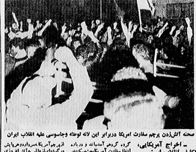
بسیاری از دانشجویان و کارکنان دانشگاه تهران در تظاهراتی که در روزهای گذشته در تهران برگزار شد، شرکت کردند. در این تظاهرات، شعارهای ضد امپریالیسم و در حمایت از استقلال و آزادی ایران سر داده شد.