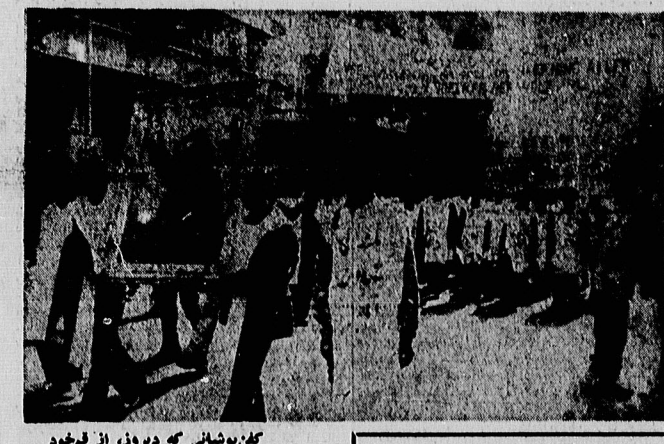
گفتگوشانی که دیروز، از قم خود را به تهران رسانده بودند دو نمایان استقبال مردم تهران، دست به راهپیمایی علیه امپریالیسم امریکادزد

بلذعت حوزه علمیه قم و جامعه روحانیت مبارز تهران