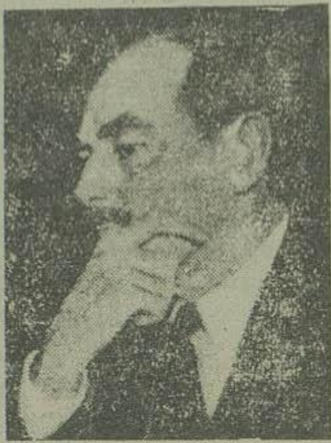
سنا تور بر پیجز کاندیدای وزارت امور خارجه امریکا