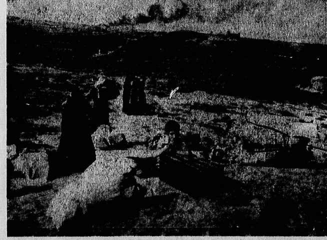
این تانک متعلق به ارتش جمهوری اسلامی ایران است که در نوار مرزی بر اثر انفجار مین، آسیب دیده - حکومت بعثی عراق در ماههای پیش ، با بهره گیری از هر فرصتی ضمن تجاوز به مرز های ایران به کشتن مین های ضد تانک در مرز کشور ما دست زد. این مین ها از نوع بلستیکی وساخت اسرائیل است و دستگاه میناب در برابر آن بی اثر است. جای هیچگونه شکنی نیست که عراق از مین های ساخت اسرائیل برای ضربه زدن به انقلاب اسلامی ایران استفاده کند.

در مراسم بزرگداشت روزشکارتان با حضور رئیس جمهوری گفتند: تحریم المپیک مسکو مجدداً بررسی میشود در صفحه ۱۲