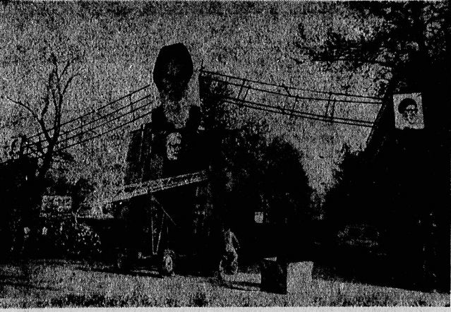
بناسبت جشن قطع رابطه با آمریکا جهانخوار، از آغاز کوچای که اقامتگاه موقت رهبر انقلاب در آن قرارداد، نیز طاق زده شد. عکس، حین ساختن این طاق نصب تیرداشته شده است. در صفحه ۲

در مورد سیاست نفتی صدام حسین باید به ملت مسلمان و انقلابی عراق توضیح دهد علی اکبر مینار وزیر نفت از دولت عراق و صدراعظمین خواست بعثت خود توضیح دهند چرا نفت را به رایگان در اختیار منتخوران بین المللی قرار میدهند. وزیر نفت ایران در این زمینه گفت: رژیم بعثت نشانده بعثی عراق و آقای صدام حسین دژخیم بزرگ باید به ملت مسلمان و انقلابی عراق توضیح دهد در حالی که ملت انقلابی ایران از تولیدات نفتی خود استفاده و سرمایه های را که متعلق به نسل های آتی است، برای رایگان در اختیار منتخوران بین المللی میگذارد آنها بجهت جرات بعمود حق میبندند که صادرات نفتی خود را از ایران داده و قیمت ها را پایین نگه دارند. این عروسکهای دست نشانده امپریالیسم باید توضیح دهند که چرا در حالی که ایران نفت را به بهای بیشکای ۲۵ دلاری می فروشد آنها همان نفت را به بیشکای ۲۸ دلار میفروشند. آیا این توکری امپریالیسم از کسبه مردم مسلمان و غیرتند عراق نیست ؟