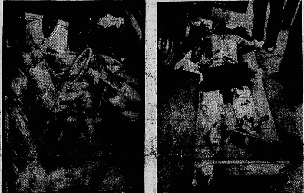
اجساد مطهر شهدا چنان در آتش نفاق سوخت که تشخیص آنان میسر نیست.