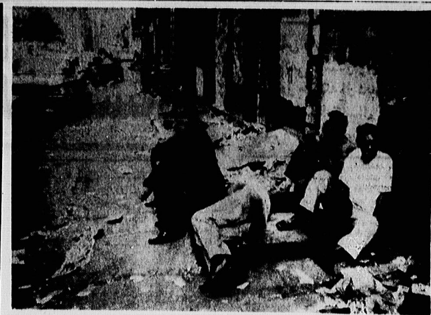
انجا نیویورک است و اینها مردم فقیر و بی‌پناه این شهر هستند. با برنامه های اقتصادی ريگان فاصله وحشتناک طبقاتی در این کشور روز بروز بیشتر میشود.

برای تعدادی از صنایع مانند لوله استیل ایتالیا و آلمان غربی و بعضی از کارخانه‌ها مانند تاسیسات خودصنایعی سفارشات شوری برای ادامه حیات آنها ضروریست. با این همه سفارش شوری و دیگر کشورهای اروپای شرقی قسمت کوچکی از دنیای صادراتی آمریکا را تشکیل میدهد و بازرگانی شرق و غرب بطور کل به ششم بازرگانی اروپای شرقی فقط آورده. متوسط صادرات غرب و ۳۰ درصد صادرات آن را تشکیل میدهد. در زمان کنسداد عمومی هیچ کشوری با این پهل تمام