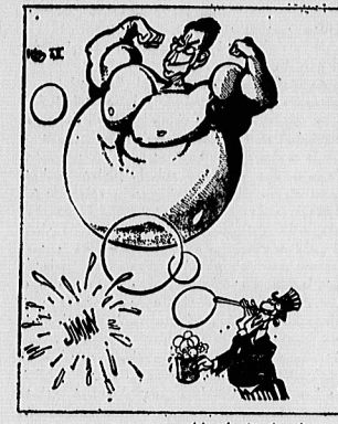
طرح از نشريات خارجی (بر طبق کميسيون اقتصادی اروپا برای ارقام) با غرب بود.

بازار اروپای شرقی و شوری را از دست نخواهد داد، اما از ارقام نشان میدهد که بازرگانی بیشتر برای غرب کناری کم اهمیت هستند تا برای شرق.