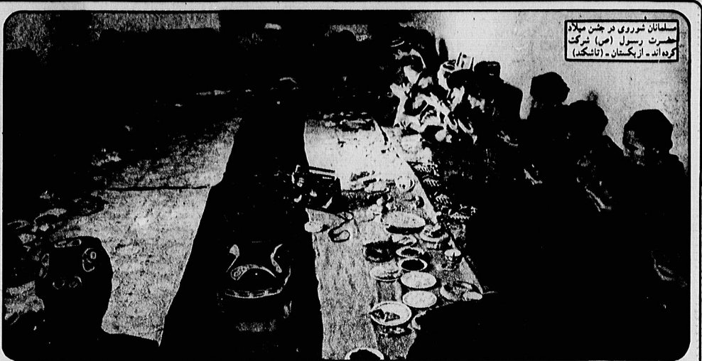
مسلمانان شوروی در جشن میلاد حضرت رسول (ص) شرکت کرده اند - از کیسکمان - تاشکند