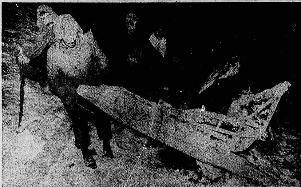
تسبی از اژدها میهمان شده جت بوئینگ ۷۲۷ در ارتفاعات بر برف اطراف لشکرک دست آمده است.