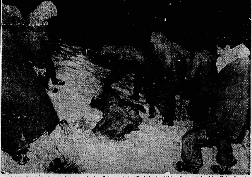
اجساد کشته شدگان حادثه سقوط هوایما، که در اطراف محل سقوط پراکنده شده اند، توسط گروه های امداد و پاسداران جمع آوری می شود.

۱۷۸ مسافر و خدمه یک فروند هوایمای جت بوئینگ ۷۲۷ هوایمای ملی ایران در نخستین ساعات دیشب در اثر یک سانحه هوایی که در ارتفاعات لشکرک تهران روی داد به طرز فجیع و دلخراشی کشته شدند. این هوایما که ساعت ۱۸ دویز پس از کنترل تمام از فرودگاه مشهد بلند شد، قرار بود ساعت ۱۹:۱۵ دقیقه همان روز در فرودگاه مهرآباد فرود آید ولی در اثر یک سانحه که هنوز علت آن به درستی مشخص نشده، فاجعه آیدزترین سانحه تاریخ هوایمای ایران را در ارتفاعات لشکرک بوجود آورد. گزارش تکان دهنده خبرنگاران اطلاعات که تنها خبرنگاران داخلی بودند که پس از آگاه شدن از حادثه در محل حضور یافتند نشانگر صق فاجعه دریاک نخستین سانحه هوایی هوایمای ملی ایران است. خبرنگاران اطلاعات که در ساعت ۱۹:۳۰ دقیقه از طریق منابع خبری از احتمال سقوط یک هوایما در منطقه لشکرک آگاه شده بودند به محل حادثه رفتند و پس از عبور از جاده های برف زده و مناطق پوشیده از برف به سوی ارتفاعات پوشیده از برف که در جهت فرودگاه مهرآباد قرار داشت زمامی بود که مستقیمتین مسافران پرواز ۲۹۱ مشهد-تهران از پرواز سانحه آگاه شدند و بکارچه به شیون وزاری پرداختند. گروهی از خبرنگاران فراتر از دو جاسم تلاشی شده و سوخته مسافران سرخو سیاه رنگ شده بود. سرخو رنگ فراتر جاری شدن خون و سیاه رنگی در اثر سوخته شدن تعدادی از اجساد. صحنه های دلخراش دیگر این حادثه در سرودگاه مهرآباد روی داد و آنجا نگران زمامی بود که مستقیمتین مسافران پرواز ۲۹۱ مشهد-تهران از پرواز سانحه آگاه شدند و بکارچه به شیون وزاری پرداختند. گروهی از خبرنگاران