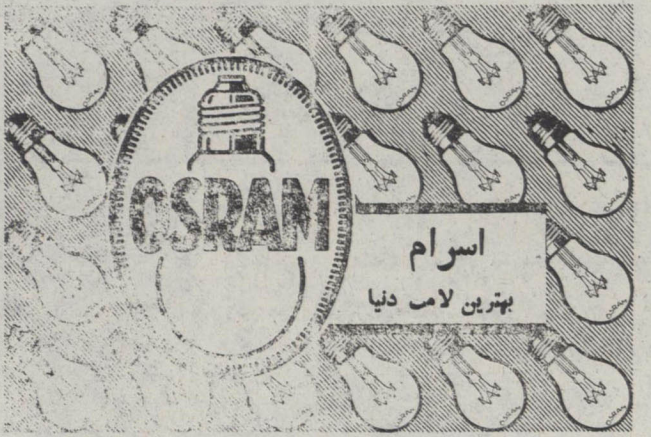
فروش تجارتي : توسط اداره ا. ت. آ. م طهران

نمایندگان دول متفق با تمام قوای خود برای عقب گذاردن عملیات او اقدام نموده که او را از تخت سلطنت حبشه بریز بکشند و در ۲۷ سپتامبر ۱۹۱۶ مساعی نمایندگان دول مذکور منتهی بموقبت گردیده و توسط رئیس بزرگ روحانی مسیحیان خلق او را از سلطنت اعلام نموده و خلاه او « پرنس زدیتو » را برای پادشاهی حبشه انتخاب کردند و راس قاری ( امپراطور فعلی حبشه ) را به نیابت سلطنت گماشتند که بجای پرنس مشار الیه کار کند یاسو برای استرداد ملک خویش توسل بیعضی از قبایل شده و با حکومت جدید مخالفت نموده تا آنکه در ژانویه ۱۹۲۱ دستگیرولی امپراطوری او را عفو نمود بشرط آنکه از منطقه « راس کاسا » که منطقه بزرگترین امرای حبشه است و یکی از طرفداران قوی و صمیمی امپراطور بی و راس قاری بوده خارج نشود . و اینک بطوری که آژانسهای خارجه اطلاع دادند مشارالیه از منطقه مزبور فرار کرده ولی او را مجدداً دستگیر کرده اند . این بود خلاصه از داستان یاسو امپراطور سابق حبشه و ضمناً متذکر می شویم که اخیراً از طرف راس قاری رژیم مشروطیت در حبشه برقرار گردید و يك مملکت مشروطه شده است و میل دارد اصلاحات جدید دز مملکت بنماید و یکی از اقدامات مهم اخیراً اقدام برای جلوگیری از برده فروشی در حبشه بوده که مطابق تمهیدات بین المللی از این قسمت جلوگیری بنماید .