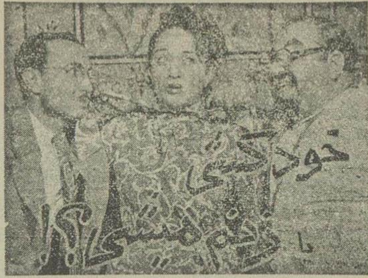
شروع ساعت ۸ پایان ساعت ۱۰ ۵۶۷۱-آ ۷-۱۰