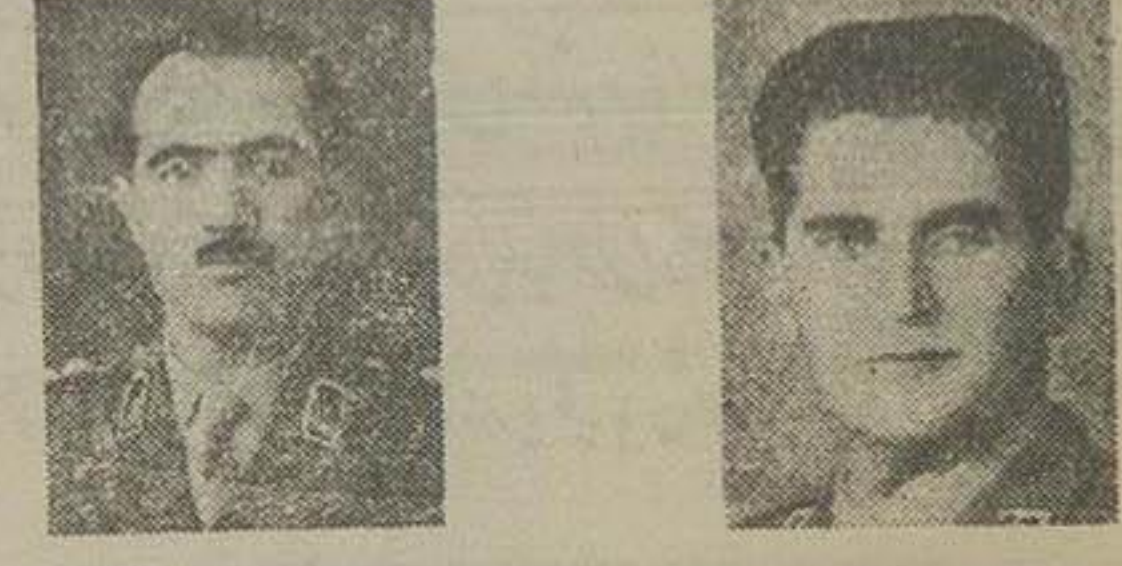
سر تیپ بیکلری سرهنگ واقعی

رای رسیدگی بجرایان حوادث تاسف آور سام تیرماه دوشهرهای اصفهان و اهواز و تعیین مسببین اصلی وهویت متولین از طرف وزارت قاع ملی آقایان سر تیپ بیکلری و سرهنگ واقعی ماموریت یافته اند که بشهر های اهواز واصفهان رفته و پس از رسیدگی کامل به جرایان امر گزارش لازم بوزارت دفاع ملی بدهند.