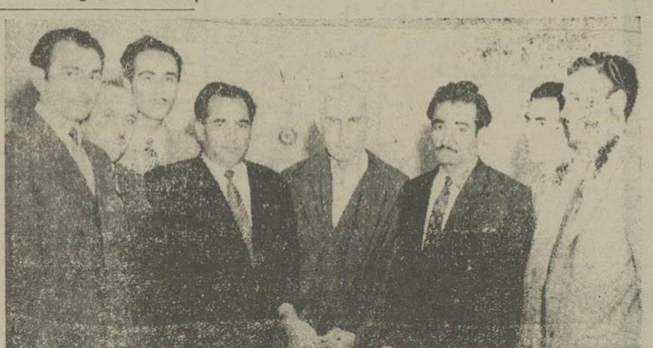
شش نفر از آقایان مدیران جرایه فارس با اتفاق آقای کریمپور شیرازی مدیر و سرش ساعت ۱۱ صبح امروز آقای دکتر مصدق را ملاقات کردند. نخست آقای کریمپور شرحی در اطراف مبارزات و فداکاریهای مردم فارس و اهالی شهرستان فسانسبیت بدولت آقای دکتر مصدق اظهار داشت و سپس آقای اهورهوش مدیر روزنامه جوش در تائید اظهارات آقای کریمپور مطالبی بیان کرد.

آقای سر تیپ محمود دولور رئیس کاره مستقل کربکبتهت فرمانده نظامی تهران و حومه تعیین و از دیروز عهده دار سمت جدید خویش گردید.