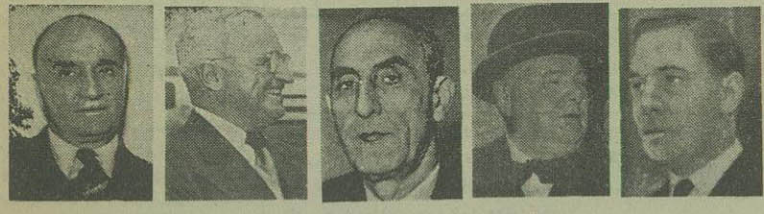
میدلتن چرچیل دکتر مصدق ترومن هندرسن

اشاره نامه مشترک در واشنگتن خیر کزای فرانسه از واشنگتن گزارش میدهد منامه مشترک پرزیدنت ترومن و مستر چرچیل که در آن برای حل قضیه نفت پیشنهادها شده در دست در همان موقع که در لندن انتشار یافت در واشنگتن نیز منتشر گردید. معاف رسمی آمریکا پس از اعلام این خبر راجع بجزئیات آن و همچنین