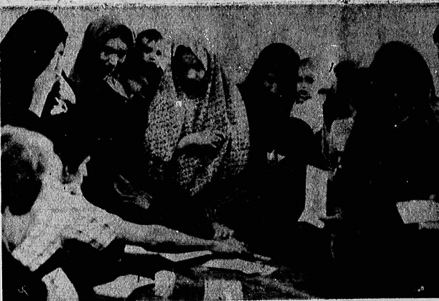
حضور فعال زنان در صحنه های رای گیری، از بدو ایجاد جمهوری اسلامی چشمگیر بود. دیروز نیز مثل تمامی انتخابات و نظر خواهی های عمومی زنان حتی باجه های شیر خوارهای صندوق را گرفتند.

آیت الله مرعشی نجفی: مجلس شورای ملی دوم با سوم خردادماه افتتاح میشود در صفحات ۳-۲