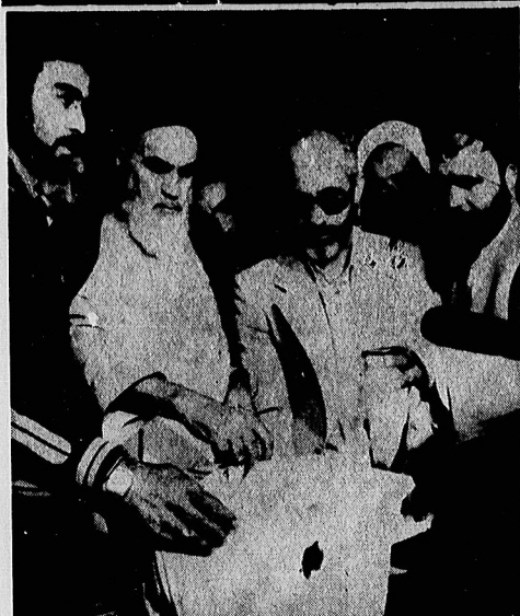
امام آیت الله مرعشی نجفی در مشهد در صحنه شماره ۱۰۰۰ انتخابات. امام هنگامی که رای می‌دادند گفتند: مبارک باشد انشاءالله، مبارک آن روزی است که ایران از سلطه اجانب مستخلص شود...