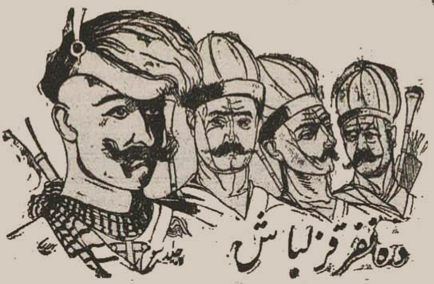
دو نفر از لباسش

دولت دانمارک در این توضیح قوراً دو نفر از آلمانیان زبردست خود را فرستاد که بان یادگان دستور دهند قورا وسایل مراجعت خود را فراهم سازند.