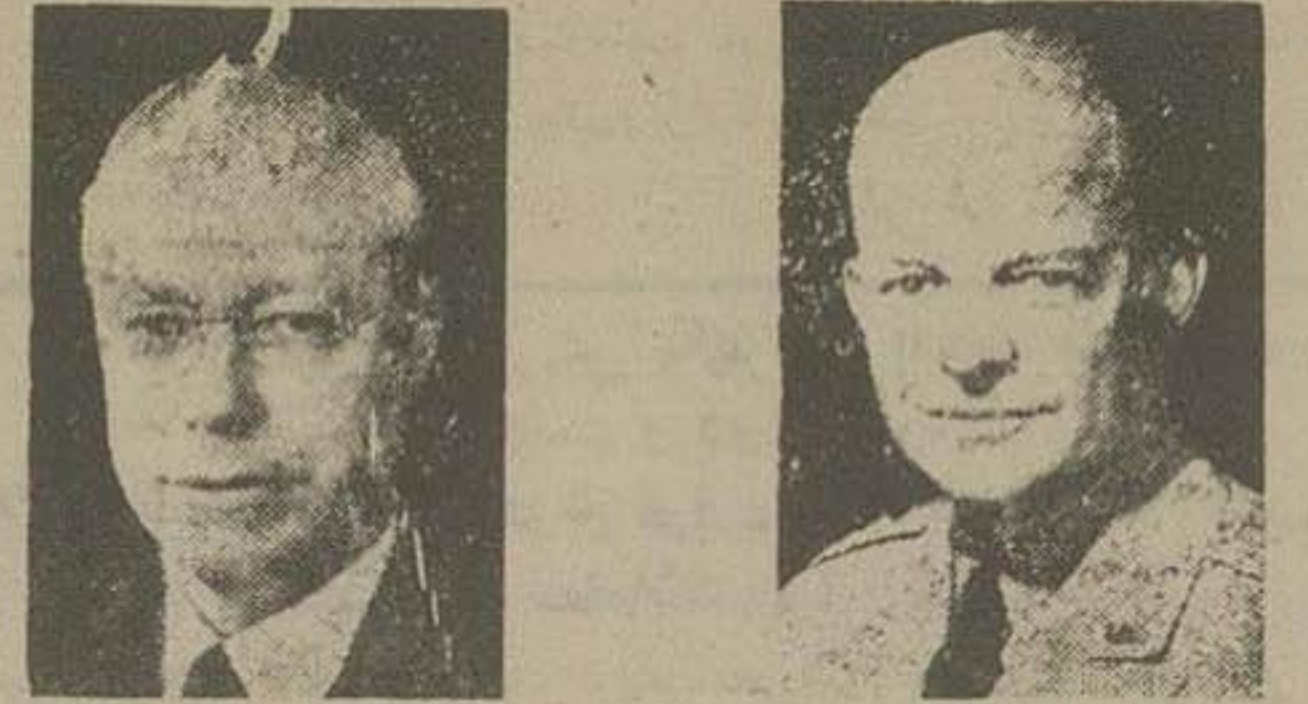
ژنرال ایزن هاور