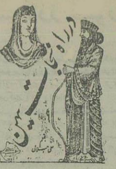
شاهکار داستانهای ملی و تاریخی

آقای مدیر معتمد روزنامه اطلاعات خواهشمند است شرح زیر را محض رعایت حال دانشجویان در آن جریبه