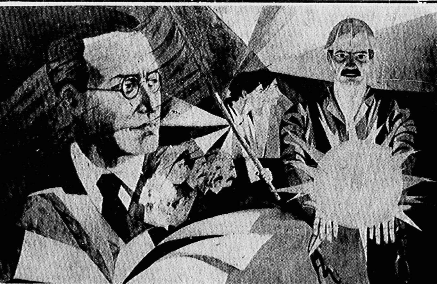
یکی از آثار شهاب موسوی زاده در نمایشگاه ارانی

و يك مقام آگاه ایرانی به خبرنگار کیهان میگوید که اینها همانانی هستند که در روزتسخیر جاسوسخانه آمریکا موفق به فرار شده اند.