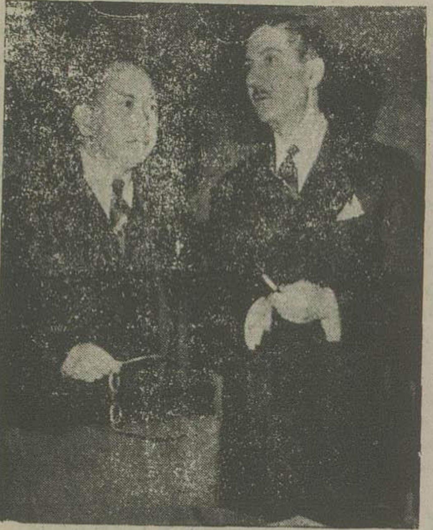
آقای انتظام در دفتر کار خود با درمورلو وزیر خارجه فیلیپین و رئیس سابق مجمع عمومی سازمان ملل متحد دربارۀ انتخاب دو همکار خویش مشاوره نمود