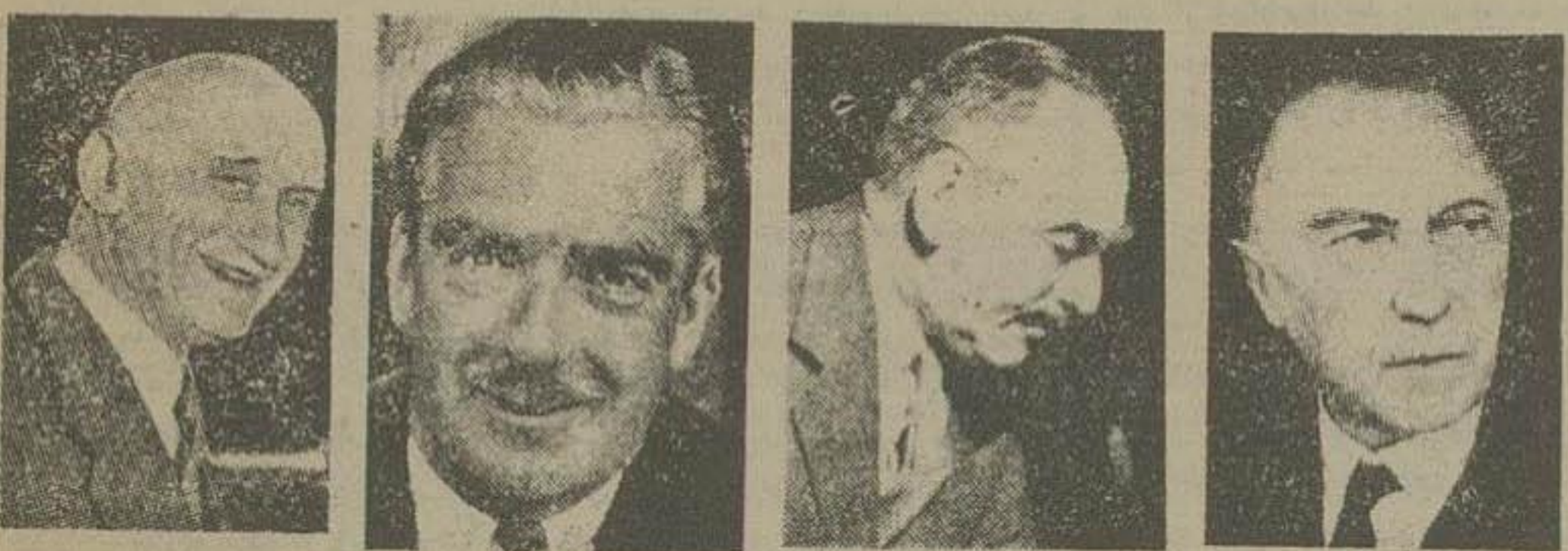
و کتر آدنایر اچسن ایدن شومان