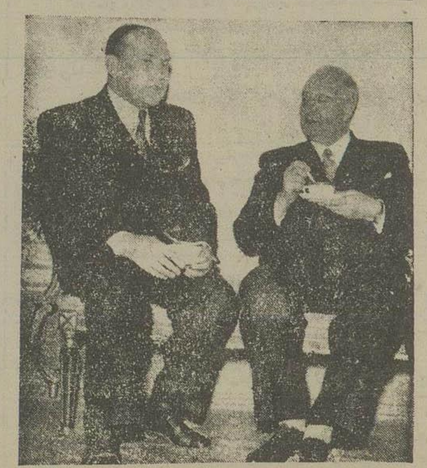
دیروز یک ساعت و نیم بعد از ظهر سادجیکف از وزیر خارجه ملاقات کرد و خبر ارسال یادداشت دولت متبوعه خود را بطالع و وی رساند و پرامون یادداشت توضیحات شفاهی داد.