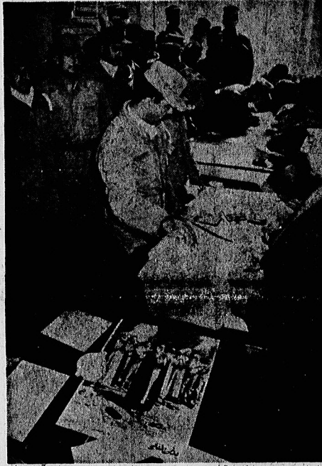
نظامیان نیرو در باگانیا آراء خود را به صندوقهای رای ریختند. رای آنها مخفی بود، و هرگز به کنشیداش که به او اعتنا نداشت رای داد.

پزشک معالج امام: فشارخون خوب، قلب منظم و دردی احساس نمی کنند