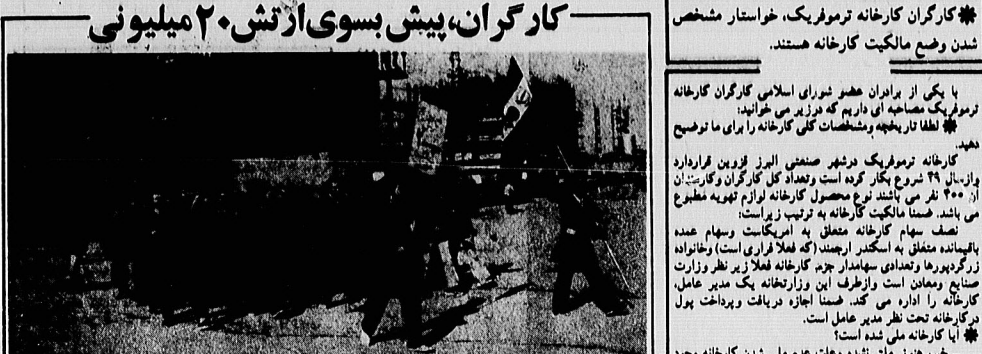
کارگران با یکی از کارگران اسلامی کارخانه تومرفیک