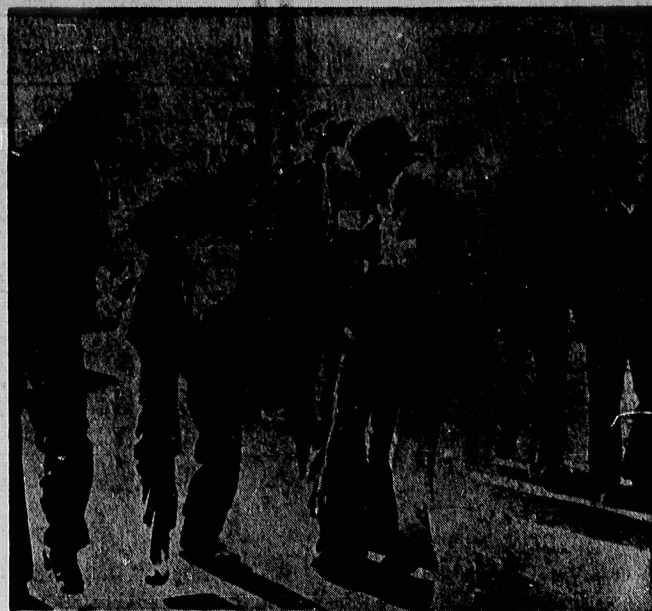
لحظاتی پس از شلیک گلوله ها، رهگذران یکی از پاسداران گلوله خورده را که آخرین لحظات حیات را طی میکند برده اند تا تابه بیمارستان برسانند. اما تریغ گلوله ها نشان دهنده تیری انداخته است.