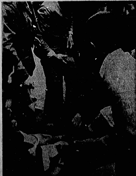
گولندا، پهن گرام انسانی را که تاحملهای بیش دهائی از زمین وایثار بود سره کربماد و زلفران حیات زده و متسلطه برچسب شهید به نظاره ایستادند.

این قضیه حقوق بشر و شورای امنیت را قدرتمند هادرست کرده اند ما مجرم بالاتر را که روسای جمهور امریکا می دانیم باید محاکمه کنیم