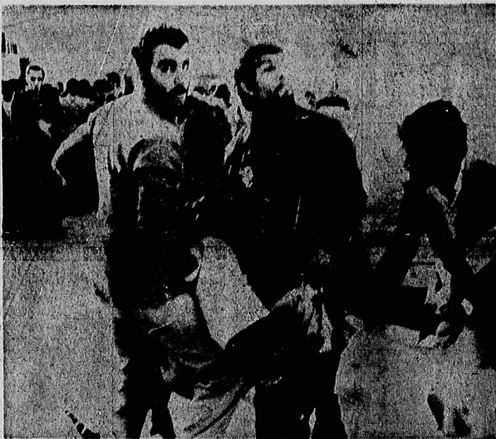
جسد نیمه جان یک پانامائی که مردم بسوی او میل انتقال میدهند تابه بیمارستان برسانند.

شماره ۲۷ آذر ماه ۱۳۵۸ - شماره ۱۶۰۲۹ - شماره ۱۵ ریسال