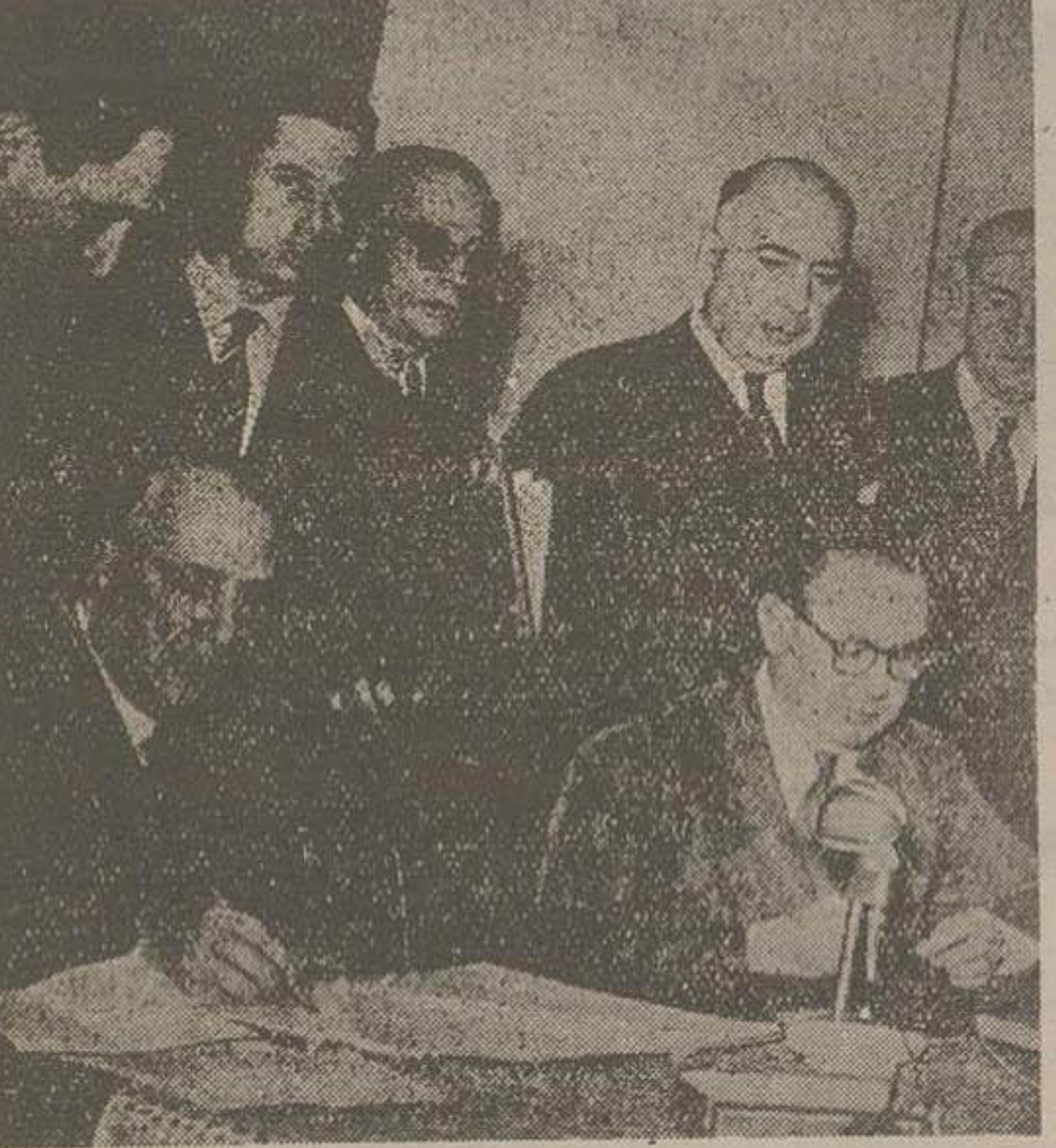
در عکس بالا آقایان انتظام وزیر امور خارجه و سفیر کبیر ایتالیا هنگام امضاء قرارداد دیده میشوند. (شرح در صفحه دو و چهارم)

دکتر براسادر رئیس جمهوری هند امروز پنج سال از تاریخ اعلام جمهوری در هند می گذرد درین مدت کوتاه هند نوین با الهام گرفتن از تعلیمات گاندی، رهبر ارجمند آنکشور علاوه بر پیشرفت های درخشانی بقیه در صفحه دو و چهارم