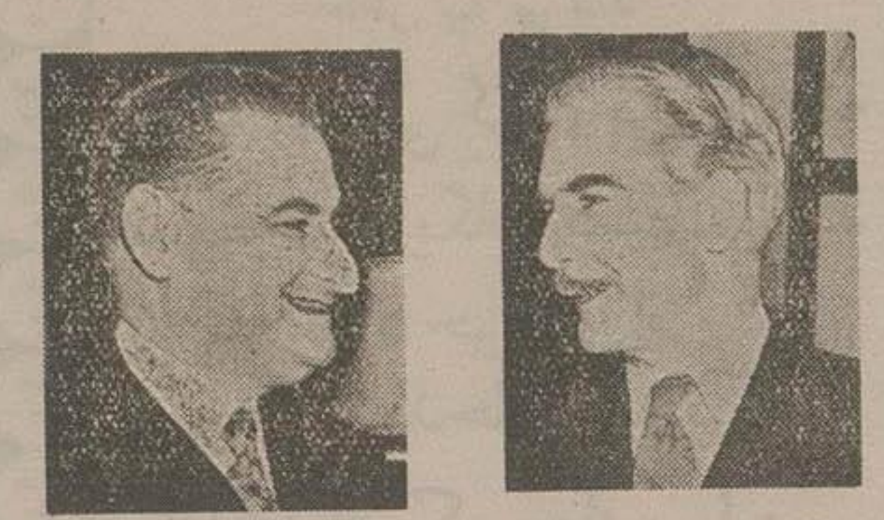
ایدن وزیر امور خارجه انگلیس سهیلی وزیر امور خارجه ایران در لندن

ملاقات دیروز آقای علی سهیلی سفیر کبیر دولت هاشمی در لندن با سرآنتونی اینن وزیر امور خارجه انگلستان مورد بحث محافل سیاسی لندن قرار گرفته است، اخبار واصله حاکیست که در این ملاقات راجع به پیمان دفاعی خاور میانه مذاکراتی بعمل آمده و سفیر کبیر ایران نظر دولت متبوع را نسبت به اجرای این امر اعلام داشته است.