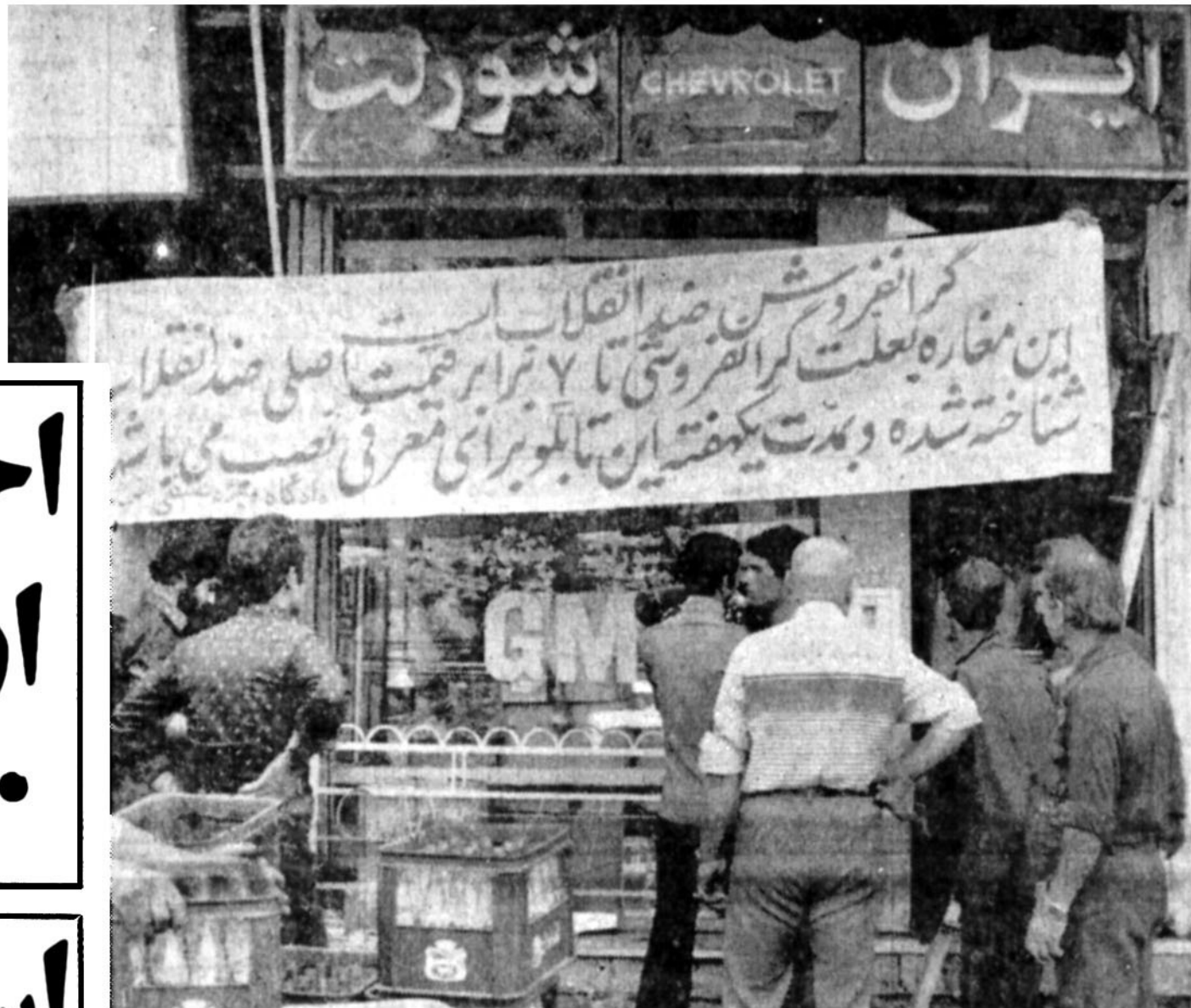
مغازه فروش لوازم‌بندی در قزوین که داغ ضد انقلابی بودن برایشانی صاحب آن زده شده است

بخش موسیقی آرادیو تلویزیون ممنوع شد تنها سرود های انقلابی و مارش از رادیو تلویزیون بخش میشود در صفحه ۱۲