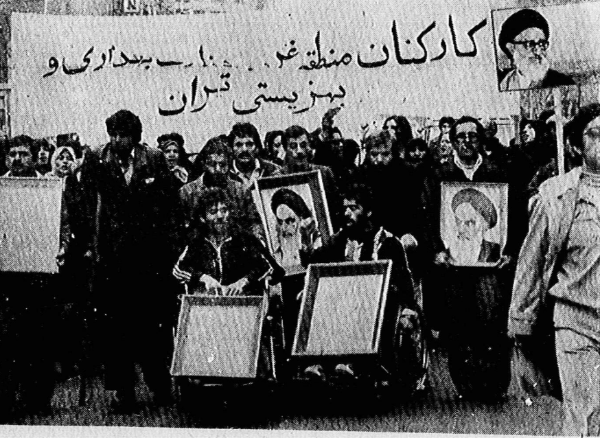
تظاهر کنندگان امروز فریاد میزدند: سواست این دنیا، فریادها یکی شد، ای موگ بر امریکا