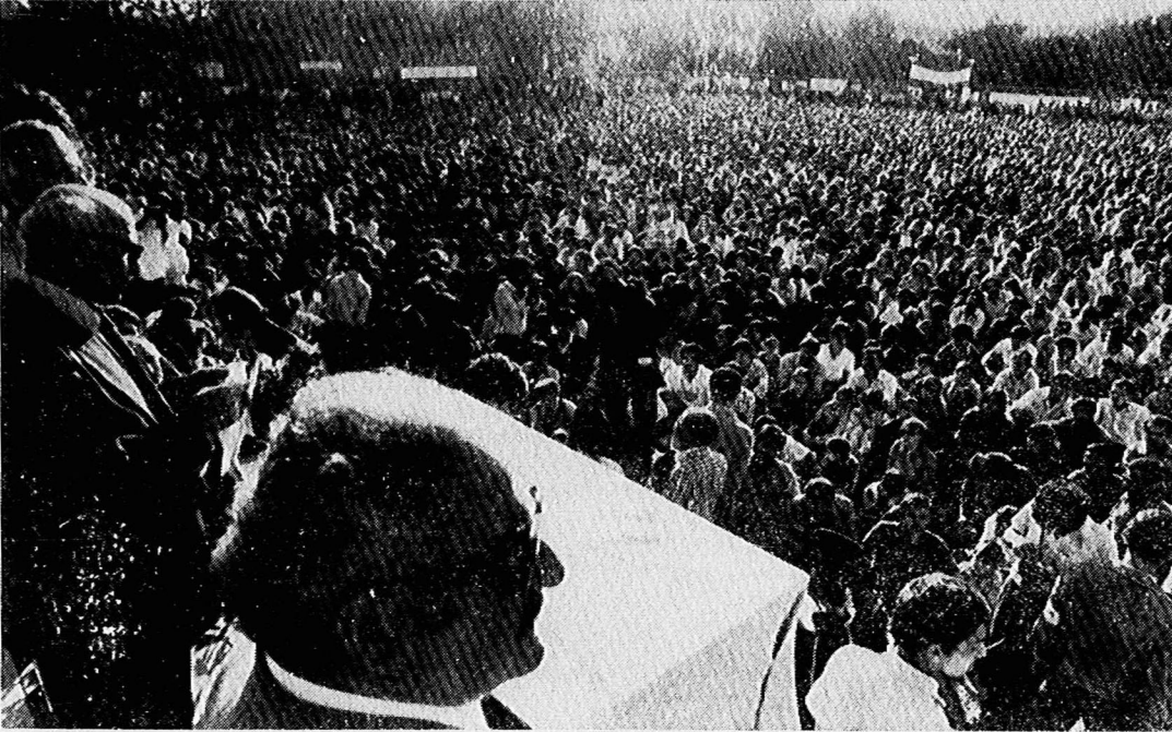
در مراسم عظیم دیروز، گروه کثیری از اعضاء و هواداران حزب توده ایران، خانواده شهدا و اعضاء کمیته مرکزی حزب شرکت داشتند. عکس، گوشه‌ای از اجتماع کنندگان را در زمین چمن دانشگاه صنعتی نشان می‌دهد. (صفحه ۴)