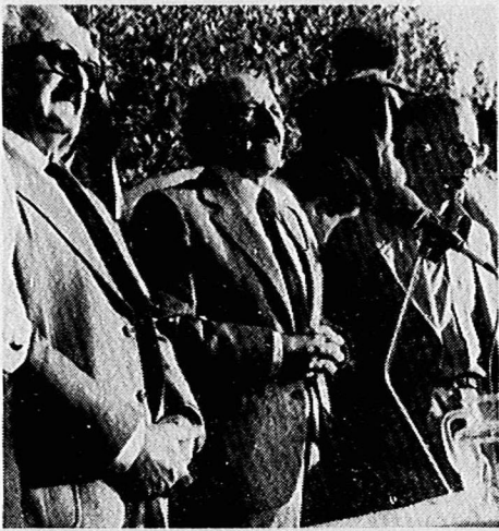
رفیق نورالدین کیا نوری دبیر اول کمیته مرکزی حزب توده ایران در مراسم پرورش می‌گوید. در طرفین رفیق کیا نوری، رفقا ابوتراب باقرزاده و تقی کی‌منش اعضاء هیئت سیاسی کمیته مرکزی حزب توده ایران در عکس دیده می‌شوند