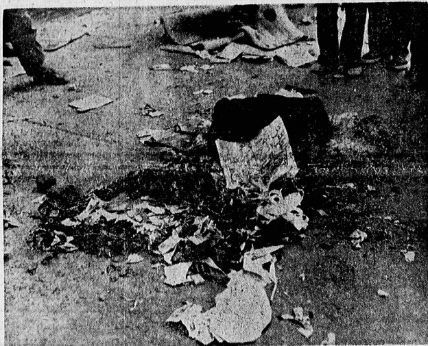
عکس فوق محل انفجار نارنجک در نماز جمعه تبریز است. در عکس، عبا و کتشیهای شهید آیت الله مدنی امام جمعه تبریز دیده میشود.

آیت الله سیداسدالله مدنی امام جمعه و نماینده امام در تبریز دیروز بمباران اقامه نماز جمعه بر اثر انفجار نارنجک به شهادت رسید. در این واقعه همدای از نمازگزاران نیز شهید و زخمی شدند.