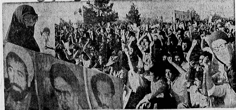
میلیونها نفر در تهران و شهرستانها در سوین سالگشت و فات آیت الله طالقانی بار دیگر با این مجاهد ستوده پیمان تازه کردند. عکسها، از مراسم بزرگداشت آیت الله طالقانی در تهران (بهشت زهرا) برداشته شده است