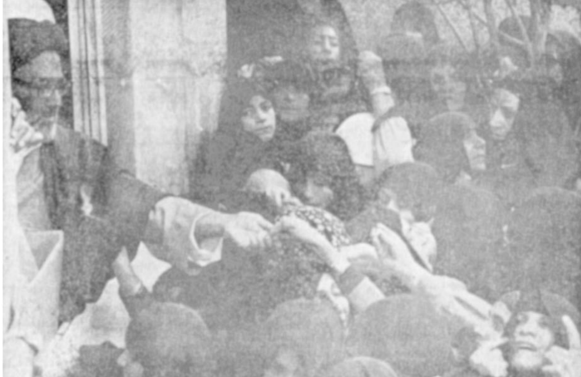
گروه‌های مختلف زنان زیست‌آلات و نسفینه‌های خود را ، هرچند هم که ناچیز باشد ، برای خانسازای مستضعفان هدیه می‌کنند