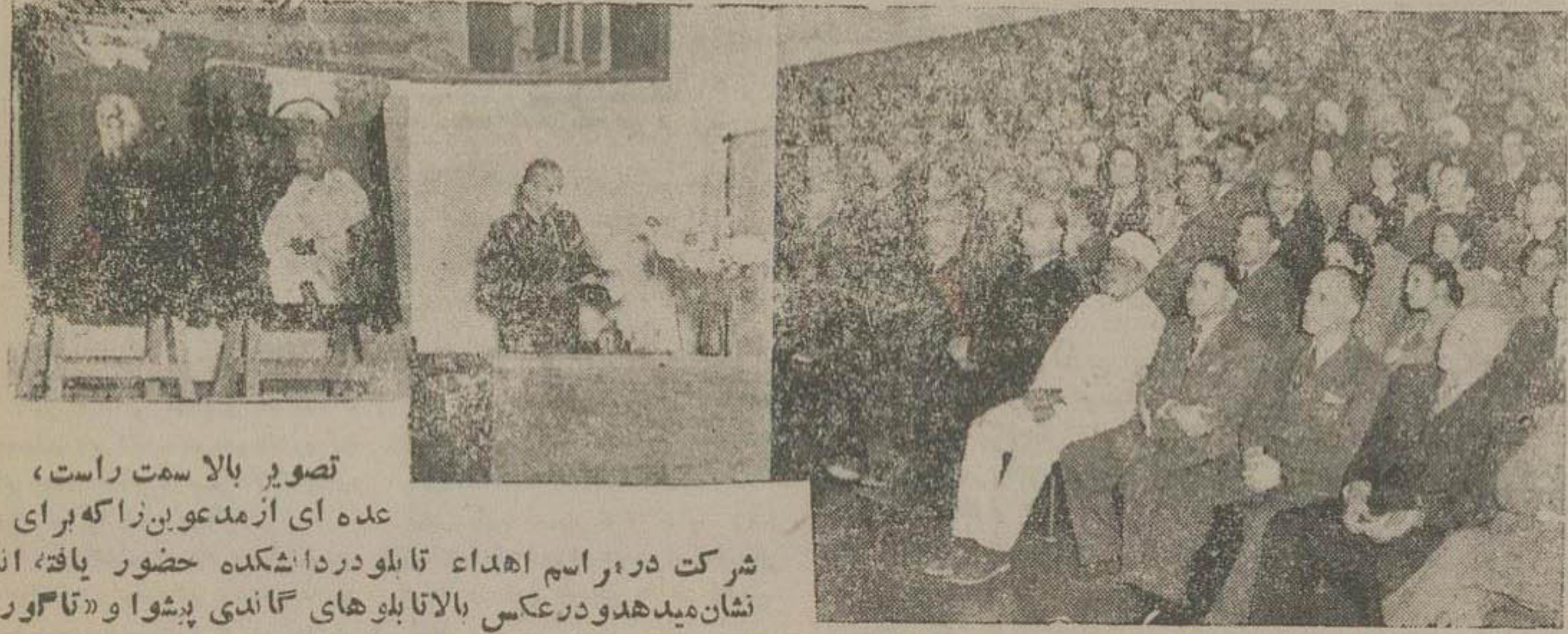
تصویر بالا سمت راست، عده ای از مدعوین برای شرکت در مراسم اهداء تابلو در دانشگاه حضور یافته اند نشان میدهند در عکس بالا تابلوهای گاندی پشوا و تاگور، فیلسوف هندی مشاهده میشود

تقاضای رئیس دانشگاه برای برقراری روابه نزدیک بین هند و ایران