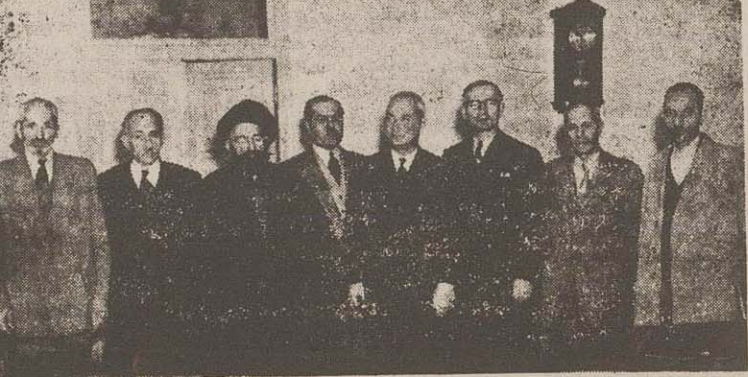
فرماندهای تهران و اعضای انجمن نظارت انتخابات

سال ۱۹۵۲ باهالی امریکایز نیست که طبق تحقیقات دقیق در این مسافرت بعمل آوردن قطع پیدا کردم در سال آیند نیز بین دول باختری و دولت شوروی جنگ نخواهد شد. استاسن که اکنون ریاست دانشگاه پنسیلوانیا را به عهده دارد ضمن مصاحبه خود با خبرنگاران اضافه کرد یکی از علل تمویق جنگ در اروپا آنست که همینکه صدای نخستین شلیک گلوله بلند شود زمینه انصاف و انقلاب از طرف متخاصران از کشور های چکسلواکی، لهستان و اوکراین فراهم خواهد شد و قانیا قابلیت ترویج هوای امریکا بر فراز کشورهای اروپای شرقی بکلی ملل آن مناطق را میسر خواهد ساخت.