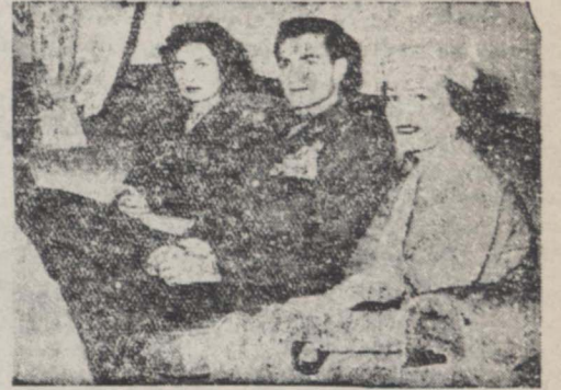
بانویگسون، همسر معاون رئیس جمهوری آمریکا در حضور شاهنشاه و ملکه دیده می شود

د از خدایان و از زودادریه... پس از پایان اظهارات آقای هندرسن، آقای نیکسون مطالبی شرح زیر بیان نمودند: آقای سفیر کبیر، بانو هندرسن و دوستان امریکائی من: بسیار خوشوقتم که خود و بانو نیکسون در میان شاهم میهن عزیز می بینم، ایران هیجدهمین کشوری است که من در مسافرت خود به ووردنیا دیدن میکنم من از این مسافرت تجربیات فراوان آموختم و بر معلوماتم چند برابر اضافه شدن تا قبل از این مسافرت، ایران و پاکستان و هندوستان و سایر کشورهای خاور دور و خاورمیانه را فقط از روی نقشه و عکس و فیلم میشناختم اما پس از این مسافرت درک کردم که واقعا این بازدید نشورهیچقدر برای من جالب و جوهی و مفید بوده است و چقدر اینگونه مسافرها و دیدارها و بازدیدها در تکمیل روابط بین ملتها مؤثر و مفید است، در تمام نشور هائی که من مسافرت کردم با احساسات گرم و صمیمانه ای مواجه شدم، مایه یاد این احساسات برای تکمیل مبانی دوستی