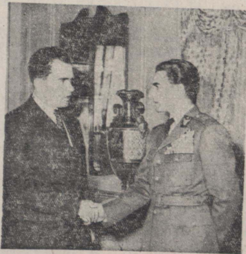
آقای ریچارد نیکسون معاون رئیس جمهوری امریکا هنگام شرفیابی بمشور شاهنشاه دیده می شود

نیکسون پس از پایان جنگ بین الملل دوم بمشورت کمیسیون امریکایی کهک های خارجی امریکا انتخاب شد و بارویا رفت و چندی دربارۀ شرایط اقتصادی اروپا مطالعه نمود و وقتی با امریکا بازگشت مقدمات اجرای برنامه مارشال را که در احیای اقتصادات اروپا نقش میداد، درسالهای بعد بازی کرد. نیه نوده، وی طرفدار جدی ادامه و توسعه برنامه کیک بکشورهای خارجی است و در این راه خدمات شایسته ای انجام داده و بیوسته در مجلسین امریکا زاین نظر طرفداری کرده است. نیکسون بواسطه خدمات برجسته ای که انجام داده در سال ۱۹۶۸ از طرف ائمان تجارت امریکا بعنوان یکی از زده مرد برجسته و خدمتگزار امریکا سرئی گردید و در سال ۱۹۵۰ بمشورت منا برگزیده شد و جوان ترین عضو بقیه در صنفه یازدهم