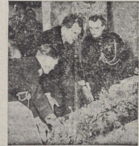
آقای نیکسون معاون رئیس جمهوری آمریکا تاج گل شاد آراگامه اعلیحضرت قید میکنند. دو نفر از آجودانهای نظامی نیز هنگام تاج گل دیده می شوند

د از خدایان و از زودادریه... پس از پایان اظهارات آقای هندرسن، آقای نیکسون مطالبی شرح زیر بیان نمودند: آقای سفیر کبیر، بانو هندرسن و دوستان امریکائی من: بسیار خوشوقتم که خود و بانو نیکسون در میان شاهم میهن عزیز می بینم، ایران هیجدهمین کشوری است که من در مسافرت خود به ووردنیا دیدن میکنم من از این مسافرت تجربیات فراوان آموختم و بر معلوماتم چند برابر اضافه شدن تا قبل از این مسافرت، ایران و پاکستان و هندوستان و سایر کشورهای خاور دور و خاورمیانه را فقط از روی نقشه و عکس و فیلم میشناختم اما پس از این مسافرت درک کردم که واقعا این بازدید نشورهیچقدر برای من جالب و جوهی و مفید بوده است و چقدر اینگونه مسافرها و دیدارها و بازدیدها در تکمیل روابط بین ملتها مؤثر و مفید است، در تمام نشور هائی که من مسافرت کردم با احساسات گرم و صمیمانه ای مواجه شدم، مایه یاد این احساسات برای تکمیل مبانی دوستی