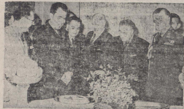
از راست بچپ تیمسار سپهبد زاهدی نخست وزیر، عمل وزیر کشاورزی، هندیس سفیر تیر امریکا، فرمانداران کابل وزارت پست و تلگراف، نیکسون معاون رئیس جمهوری آمریکا و دکتر جهان شاه وزیر بهداشت در جلسه معارفه دیروز در وزارت خارجه دیده میشوند

بناسبت جشن فرخنده آذربادگان از طرف اداره کل تبلیغات و انتشارات دوتونه تابلو رنگی که یکی از روی تئاتر اعلیحضرت همانون شاهنشاهی تهیه شده و دیگری بکنفرانس ارتش ایران را در حال پیشروی (عکس بالا) نشان میدهد در آذربادگان چاپ شده و روزیست و یکم آذر در اختیار تمام وزارتخانه ها و ادارات دولتی و مؤسسات ملی بدارده میشود تا در سرتاسر کشور بین طبقات مختلف قاطبه ملت ایران بخش و توزیم گردد. دوتا بلوری رنگی تئاتر شاهنشاه که کلام الله مجید در بالای آن جای گرفته جمله (خدا - شاه - ایران) که شمار ملیت ایران می باشد نوشته شده و در زیر عکس سرباز ایرانی نوشته شده است: «ارتش نیرومند حافظ استقلال و نامت انتخاره فرد ایرانی است»