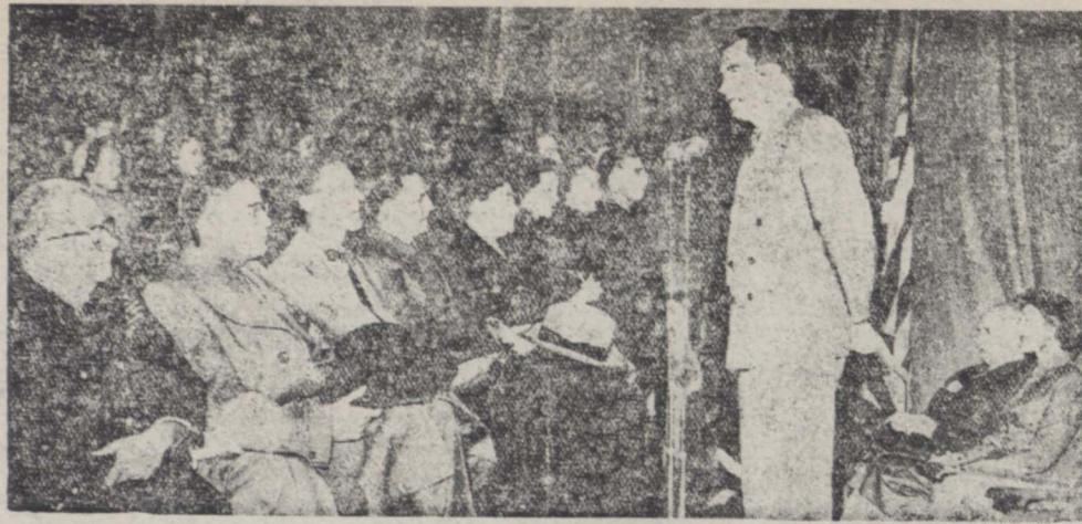
آقای نیکسون هنگام ایراد سخن در برابر امریکائیان مقیم تهران در سالن دبیرستان نورخش

من در مسافرت خویش با ایران حامل بهترین احساسات ملت و رئیس جمهوری امریکا برای ملت ایران میباشم و اطمینان دارم که ملت ایران با این امر عقدا کامل دارد که ملت امریکائیان نظری جز دوستی و همکاری نیست با ایران ندارد. مقارن ساعت هشت بعد از ظهر این مهمانی پایان یافت و آقای نیکسون با باغی همراهان خود کاخ وزارت امور خارجه را ترک گفتند. آقای نیکسون و بانو شام را بطور خصوصی با باغی چند تن از همراهان خویش صرف نمودند. آشنائی با امریکائیان مقیم تهران ساعت نه و نیم صبح امروز آقای نیکسون و خانم ایشان برای آشنائی با امریکائیان مقیم تهران که در سالن