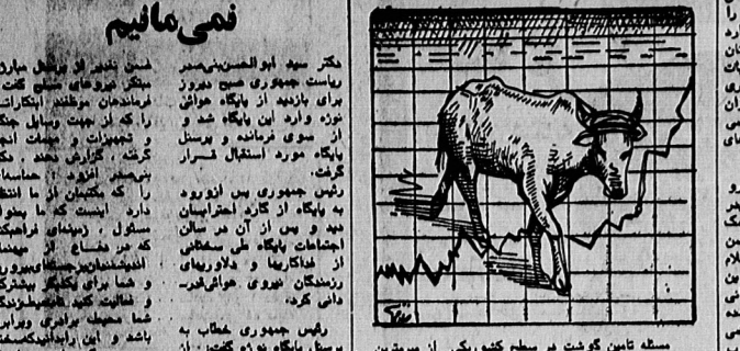
بک پیشنهاد انقلابی جهت توسعه دامپروری