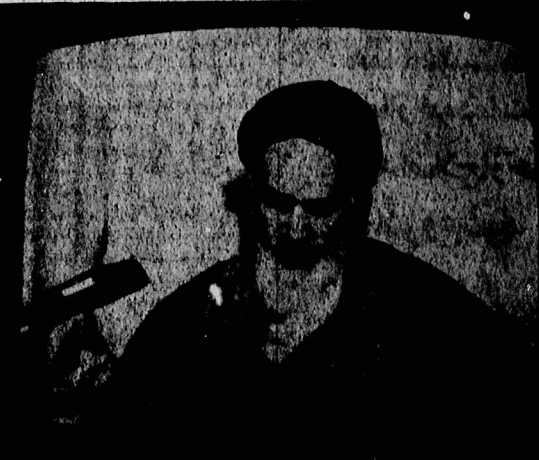
امام خمینی در پاس به سائیت آغاز سال نو...