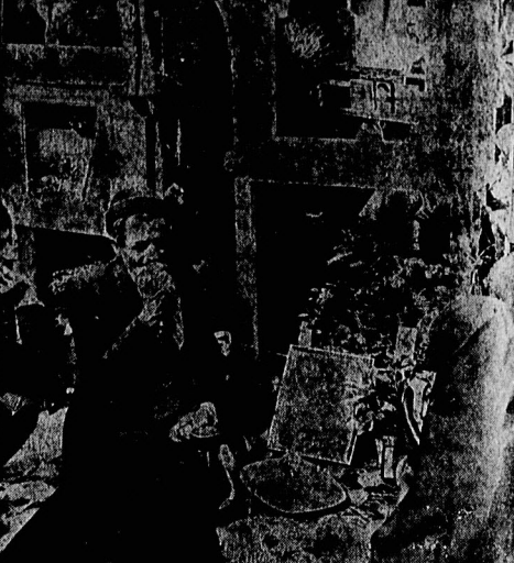
دینار سر را با رئیس جمهوری