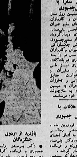
ملاقات با رئیس جمهوری