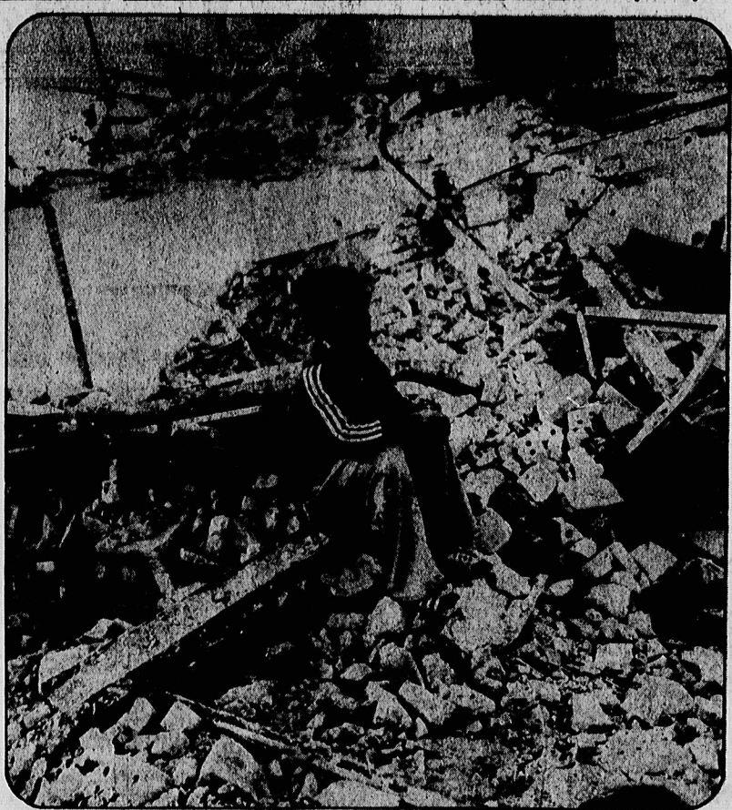
خبر نگاران خارجی پس از دیدار از مناطق ویران شده دزفول، اهواز و سوسنگرد:

جنايات صدام شبيه جنايات امريکا در ويتنام، هيو و شيما و ناکازاکی است