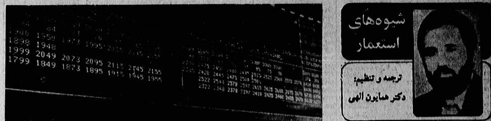
شبهه‌های استثمار ترجمه و تنظیم: دکتر مایرون امی