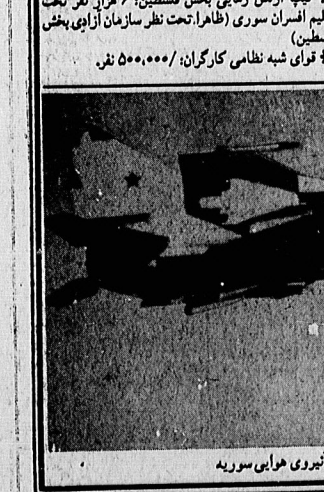
یک فروند هواپیمای میگ - ۲۵ در خدمت نیروی هوایی سوریه

نیروی هوایی: ۲۵۰۰۰ نفر هواییما: در حدود ۲۵۰ جنگنده (بعضی در انبار نگهداری می‌شوند) سنگین ۱۷ ۱۱ اسکادران با ۲۰ فروند سوخو ۲۰ ۱۷ اسکادران مسلح به ۳۰ فروند سوخو ۲۰ ۲۰ اسکادران رزمی با ۲۰ فروند سوخو ۲۰ ۱۱ اسکادران رزمی با ۲۰ فروند سوخو ۲۰ ۱۱ اسکادران رزمی با ۲۰ فروند سوخو ۲۰