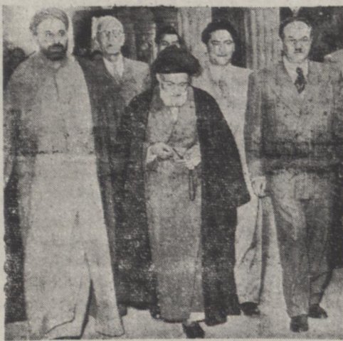
آیت الله کاشانی پس از پایان جلسه ملاقات هفتگی نمایندگان مجلس را ترک می نماید.

اخیر و حساسیت وضع کشور در حال حاضر مطالبی بیان کردند در پایان جلسه دیشب نامه ای از طرف رئیس مجلس بنخست وزیر در خصوص لزوم جلوگیری از هر گونه تظاهرات در محوطه بهارستان در روز های تشکیل جلسات ارسان شد