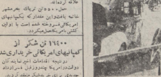
جمع از تظاهر کنندگان در چهارراه استانبول این شماره در ۱۰ صفحه انتشار یافت

۱۶۴۰۰ تن شکر از کمپانیهای آمریکائی خریداری شد در نتیجه اقدامات اخیر نمایندگان دولت در امریکا چند روز قبل فرار دادان جدیدی برای خرید شکر متفق گردید. بشرط اطلاع مقدار شکر که در قرارداد اخیر مورد معامله قرار گرفته ۱۶۴۰۰ تن است که ترتیب حمل آن برودی داده خواهد شد.