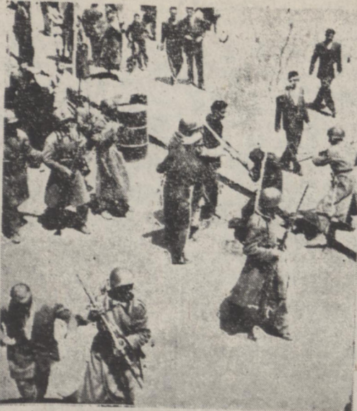
نظامیان تظاهر کنندگان را متفرق می کنند

امروز در چند نقطه دیگر شهر اعلامیه های بین مردم پخش شد ولی مامورین از پیش اعلامیه آنها جلو گیری می کردند.