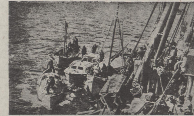
لشنتی نجات زیر دریائی موسوم به «کورتادان» در آبهای داداغل مشغول جستجوی زیر دریائی «دولمویتار» در دریا می باشد

زیر دریائی در ده دقیقه غرق شد این زیر دریائی که در سال ۱۹۵۱ به موجب برنامه کک نظامی از طرف دولت آمریکا پتریکه داده شده بود موقع مراجعت از مانور مشترک که با خان کشتیهای جنگی کشورهای جبهه ائتلافیک داده شد شب ۴ آوریل ۱۹۵۳ در دریا دانا با کشتی بازبری سوئدی تصادم و هفت نفر از ملوانان زیر دریائی که آن موقع در عرشه کشتی بودند دریا پرت می شود و توسط قایق نجات می بایند دور فراد آنها بعد از دو روز در استان فوت می نمایند.