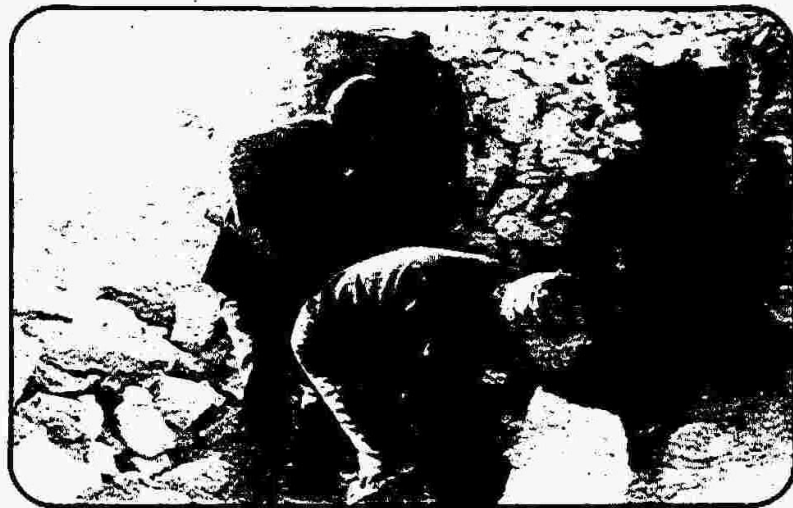
دشمن در کمین است. محرومیت‌های ما باور نکردنی است، ولی فعلا در درجه دوم اهمیت است.

تجاوز دارودسته صدام حسین به ایران بیش از پیش نقش عظیم طبقه کارگر را در امر حفظ انقلاب و دفاع از دستاوردهای آن برجسته می‌کند، زیرا بقول امام خمینی: انقلاب مال آنهاست و آنها بودند که انقلاب کردند و همان‌ها هستند که کمر همت به محو کلیه آثار امپریالیسم و ناپودی وابستگان به امپریالیسم بسته‌اند.