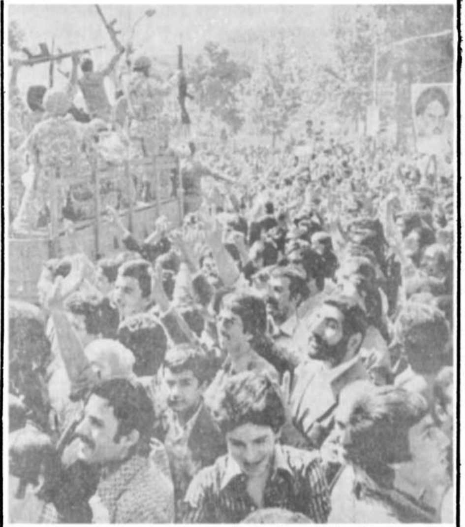
یکصد تن از رژه ارتش اسلامی و استقبال گرم و صمیمانه مردم. نظیر این صحنهها امروز در سراسر کشور و بخصوص در قم، در برابر امام خمینی شگوهی فراوان داشت.