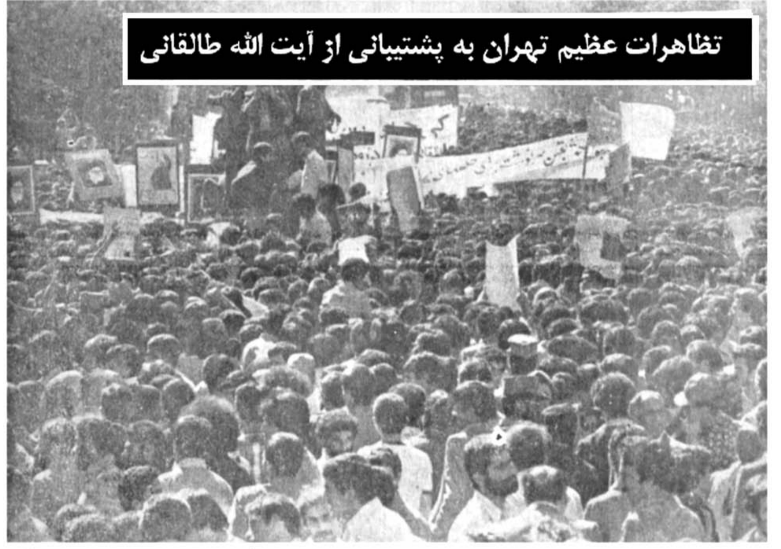
تظاهرات عظیم تهران به پشتیبانی از آیت الله طالقانی

در طول مسیر رژه گروههای مختلف به گردن نظامیان حلقه های گل آویختند سر لشکر فرید: ارتش اسلامی در قبال ارزش های توحیدی متعهد است در صفحه ۲