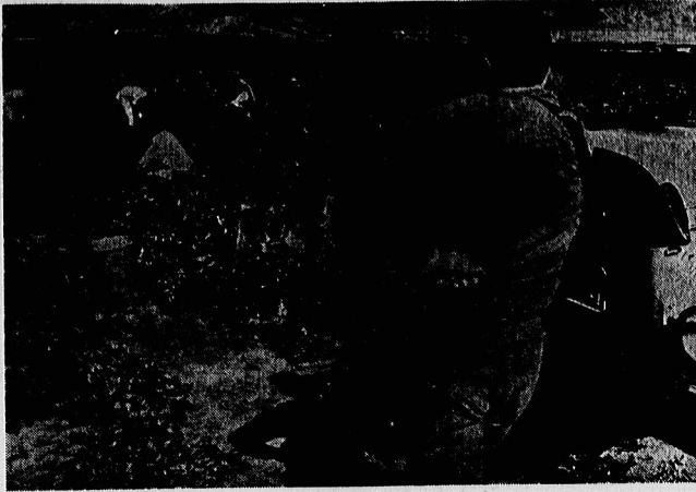
صهیونیست‌ها روزی سه بار از سوزن های اشغالی آزار می‌جویند و این سایه شوم آنها همیشه دوام خواهد یافت؟

صهیونیست‌ها می‌گویند: هیچ نیروی نمی‌تواند ما را از بلندیهای جولان به پایین کشد؛ خیانت سادات تلاش شجاعانه سوریه را برای پس گرفتن جولان عقیم گذاشت