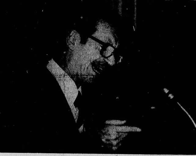
بختیار هنگام اعلام برنامه خود در مجلس شورای ملی

«جم» قبول نکرد شفقت وزیر جنگ شد در صفحه ۲ تولید پالایشگاههای ۳ شهر بازار عرضه شد وضع بنزین ۷ تا ۱۰ روز دیگر عادی میشود در صفحه ۴ انگلیس هم باخروج شاه موافقت کرد