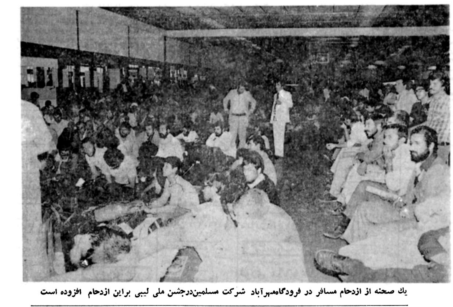
یک صحنه از ازدحام مسافر در فرودگاه مهرآباد شرکت مسلمان در جشن ملی لیبی براین ازدحام افزوده است

در سال جاری برای کمک به بودجه هوابهائی ملی که در دوران انقلاب با مشکلات اقتصادی بسیار جدی مواجه بود، شترینی داده شده است تا تعداد پرواز شرکت های هوایی فعال نمایان نسبت به سال های مشابه در گذشته کاهش یابد کالبته این مسئله هم از جمله پروتکل های بسیاری فرامروزی های بین المللی از ایران شده است. مشکل دیگری که از نظر اهمیت، بهیج صورت کمتر از معضلات یاد شده نیست، گرفتاری تهیه ارز و خارج کردن آن است که این روزها جزو مسایل سیاسی توجه بر انگیز مسافران خارجی است. محل تکمیل گذرنامه از سوی سیستم خاص حکومتی طاقتی، خارج کردن ارز مسافرتی امور بازرینی و افزایش سربع ارزهای خارجی میازار آزاد ماندن ارز، و مارک و فرانک مسئله ارز در وهله اول و مسوالمسایلی پرسود پس از آن به شکل مشکلی به نام قاجاق خودنمایی کرده که خواه و ناخواه اداسگیر مسافران عازم کشور های خارج شده است.