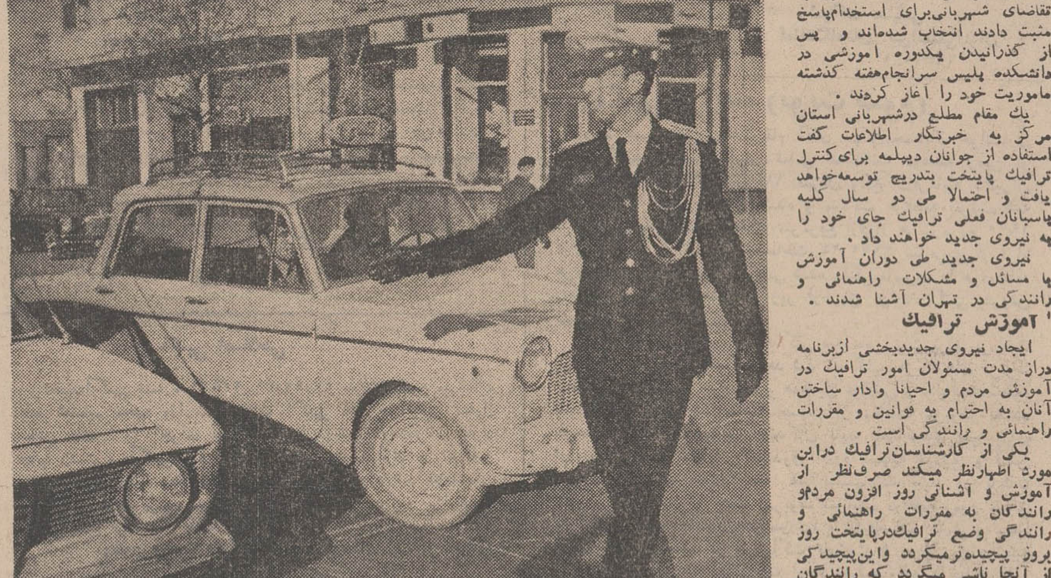
هفتاد نفر از پاساهاان دیلمه بتوانند نیروی جدیدی کنترل ترافیک را از هفته گذشته در خیابان های مرکزی تهران بعهده گرفتند. نیروی جدید بخشی از برنامه بهبود امر ترافیک پایتخت را تشکیل میدهد