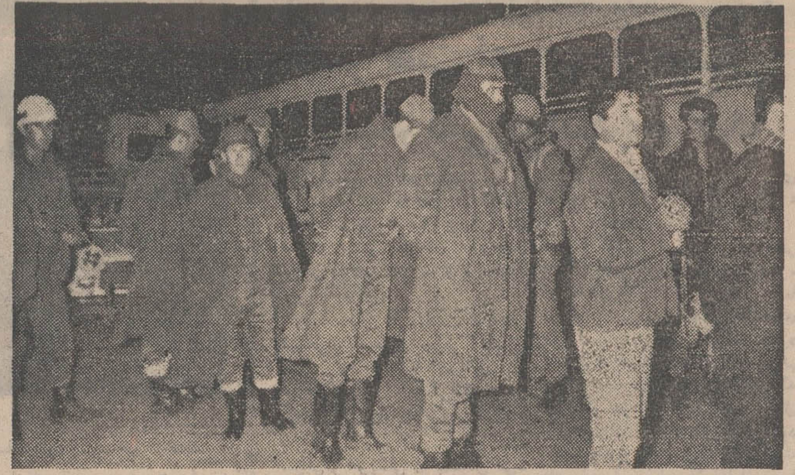
سربازان اسرائیل پس از حمله به خاک لبنان ۲۱ نظامی و غیر نظامی را اسیر کردند و با خود به اسرائیل بردند. این عکس در داخل خاک اسرائیل از اسرای عرب گرفته شده که برای انتقال به زندان یک اتوبوس سوار می شوند.