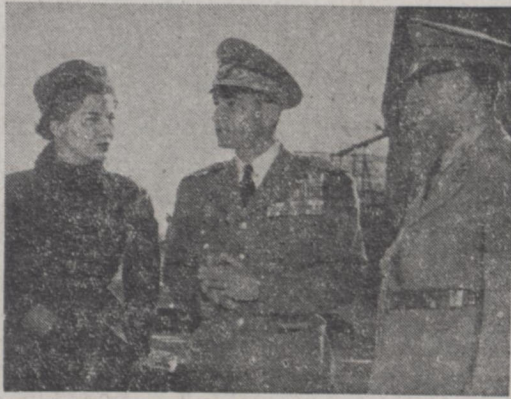
ملیحضرت هایبونی و علیاحضرت ملکه تریا با هوامی در فرودگاه مهر آباد تیسار سپهبدزاهدی نخست وزیر شرفیاب میباشند