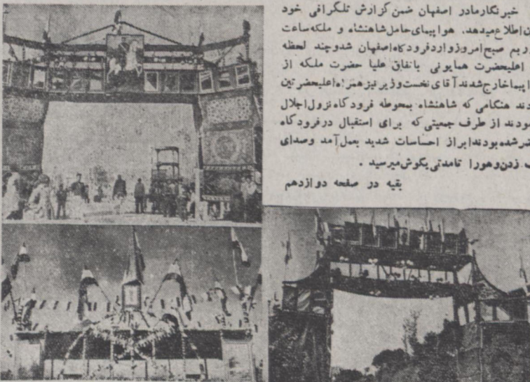
منظره‌ای از چند طاق نصرت که از طرفی طبقات مختلف اصفهان در مسیر موکب ملوکانه از فرودگاه تاباشگاه افسران در آن شهر ریافته‌اند

عصر امروز نمایندگان مختلف اصفهان بحضور ملوکانه شرفیاب شدند