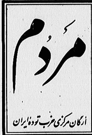
دوره هفتم، سال اول، شماره ۱۴۸ شنبه ۲۴ بهمن ماه ۱۳۵۸ - شماره ۱۵۰

طی دوران پس از پیروزی انقلاب در ایران، دولت آمریکا بتدریج واحدهای بزرگی از نیروهای دریایی و هوایی خود را از پایگاههای نظامی خود در مناطق مختلف جهان به منطقه خلیج فارس و اقیانوس هند گسیل داشته و در این منطقه مستقر کرده است. اکنون چهار ناو هواپیمابر است. «میدوی»، «کی-کی»، «هوک» و «دولورستول»، که هر یک با گروه بزرگی از زمامت موشک-انداز همراه هستند و یک ناو گروه مرکب از سی ناو جنگی، مجهز به مدرن ترین سلاحهای تهاجمی، در آبهای مجاور ویراجل ایران تدارکات جنگی و تعمیرات و هواپیماهای مسلح دریایی و فارسی و اقیانوس هند همچنان ادامه دارد. تمرکز و استقرار نیروهای مسلح عظیم و رایس منطقه، که با برنامه مشخص و هدف روشن، یعنی تهدید ایران بعد از حمله مسلحانه انجام گرفته و میگیرد، خطرناک است. جدی و واقعی و در عین حال تنها خطریست که آنها را از جانب امپریالیسم آمریکا، انقلاب ایران و استقلال کشورها و صلح و امنیت سراسر این منطقه را تهدید میکند.