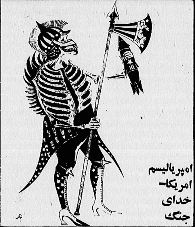
اوپر یالیسم امریکای خدای جنگ

ما میهن پرستی را انصاف خود نمیکنیم و به میهن پرستی بسیاری از غیر نوده‌ایها، که خدمتگذاران صدیق خلفه، معتقدیم. این ما نیستیم که بهمان مینم، ولی این ما هستیم که بهمان برویش را هرگز تحمل نخواستیم کرد و اجازه نمیدیم شخصیت‌های صفت نوده‌ای را از او باسطفه و هو و دشنام و افترا سلب کنند.