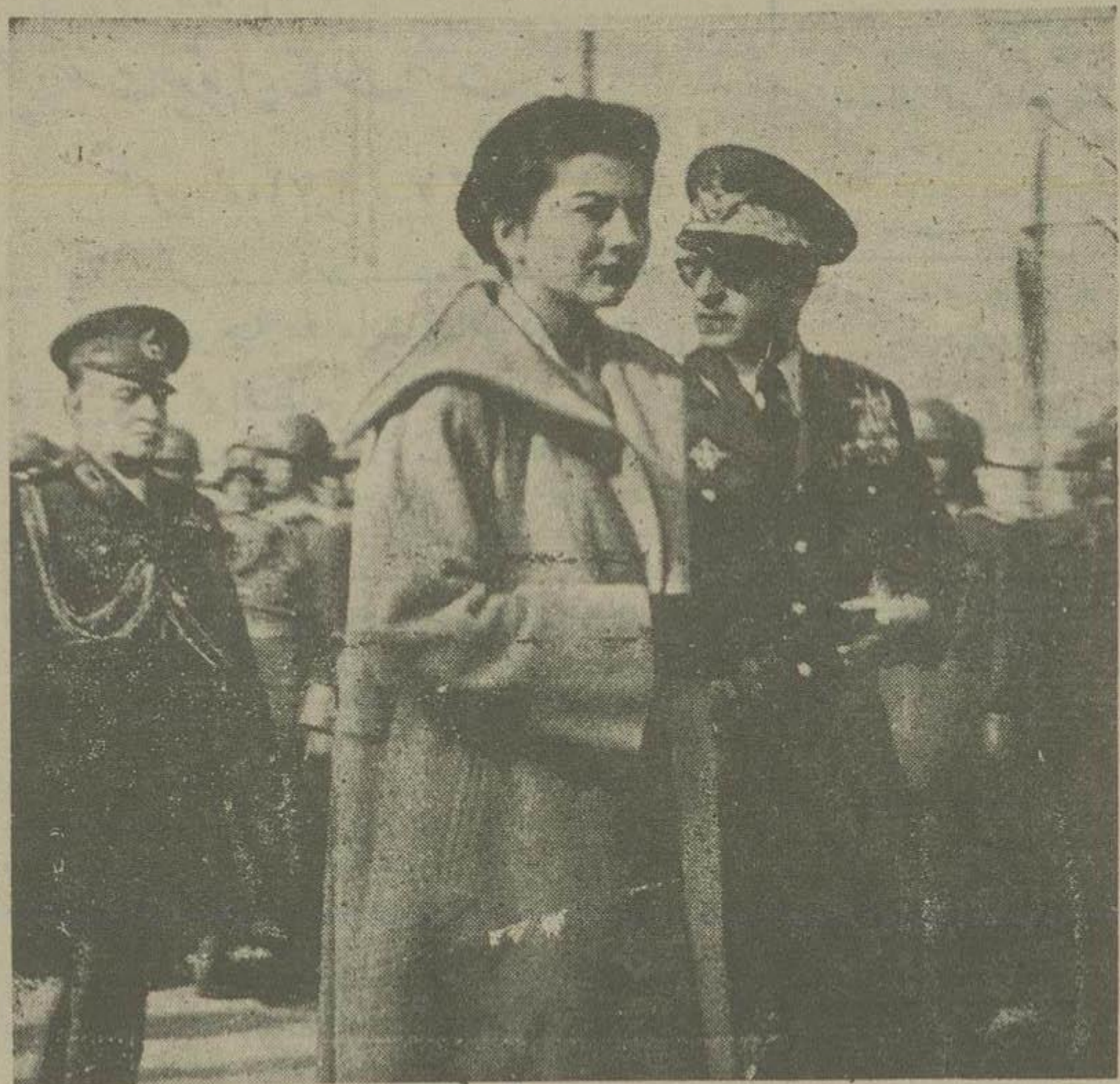
امروز صبح شاه و ملکه تهران را ترک و عازم شیراز شدند

رجال غیر نظامی ژاکت و امرای لشکر لباس رسمی نظامی در برداشته. با آنکه هوای صبحگاهی مخصوصا پس از بیارنده گیهای پی در پی اخیر ملایم و حتی کمی سرد بود ولی حتی یکی دو نفر از مشایین هم که پالتوی نازکی همراه آورده بقیه در صفحه دوم