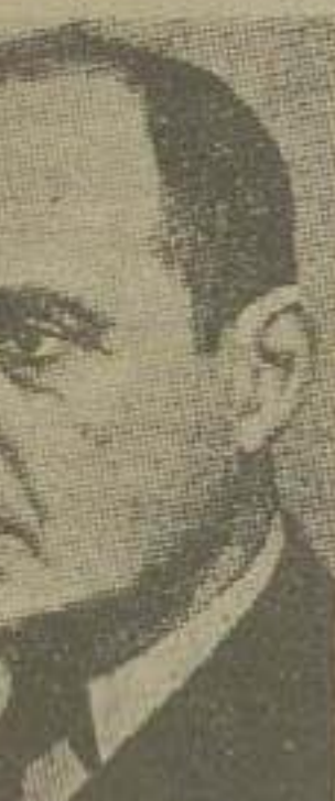
ژنرال مایو ریجوی

در محافل لندن و سایر مقامات اروپای غربی این انتصاب با خوشبینی تلقی شده است ژنرال کلارک بجای ریجوی، فرما بدهی نیروهای سازمان ملل متحد در خاور دور را اهدا گرفت