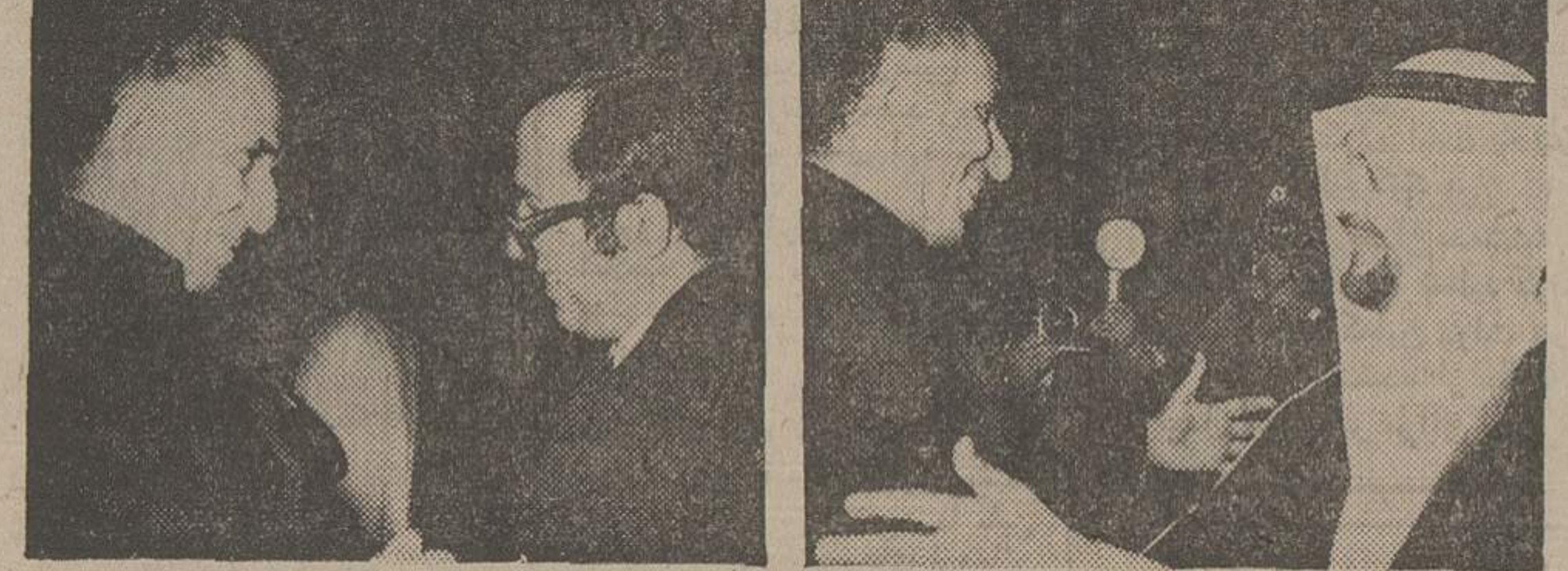
بعد از ظهر دیروز جمشید آموزگار در فرودگاه مهرآباد تقریباً مقیم شده و از وزرای نفت و دارائی اوپک استقبال آنها را به هتل محل اقامتشان همراهی میکند. عکس سمت راست آقای الرافعی وزیر ارتباطات عراق، الطیبه معاون وزیر نفت ابوظبی، درپائین زکی‌یمنی وزیر نفت عربستان سعودی، علی جیده وزیر نفت قطر هنگامیکه مورد استقبال آموزگار قرار گرفته‌اند، دیده میشوند.

مزایده اخیر تهران بسود اوپک است. الجیده اظهار داشت این اقدام ایران مسلماً بسود کشورهای تولیدکننده است. زیرا کشورهای ما در حال توسعه هستند و نیاز به درآمد بیشتر دارند. رئیس هیئت نفتی قطر در خاتمه گفت‌وگوها تهران همواره موفقیت آمیز بوده است بنابراین اگر کنفرانس تهران نیز به موفقیت منتهی شود که خواهد شد، بگام طبیعی است. زکی‌یمنی هنگام ورود ضمن آن که بیرون‌مطلبی عنوان کرد که این موضوع را تأیید نمیکند، در حالی که گفت تولید نفت از طرف عراق ادامه خواهد یافت و در حال حاضر بی‌بهره خلیج فارس نبود ندارد. ولی وی تصریح نمود که کاهش تولید نفت در قیمت گذاری اثر بگذارد. زکی‌یمنی قبل از ورود به تهران در یک مصاحبه مطبوعاتی با مجله نفتی «میدل‌ایست اکونومیست» گفت: در کنفرانس وزیران اوپک در تهران انتظار می‌رود قیمت های جدیدی گزارش شود که ما از قیمت صادراتی بسیاری از کشورهای