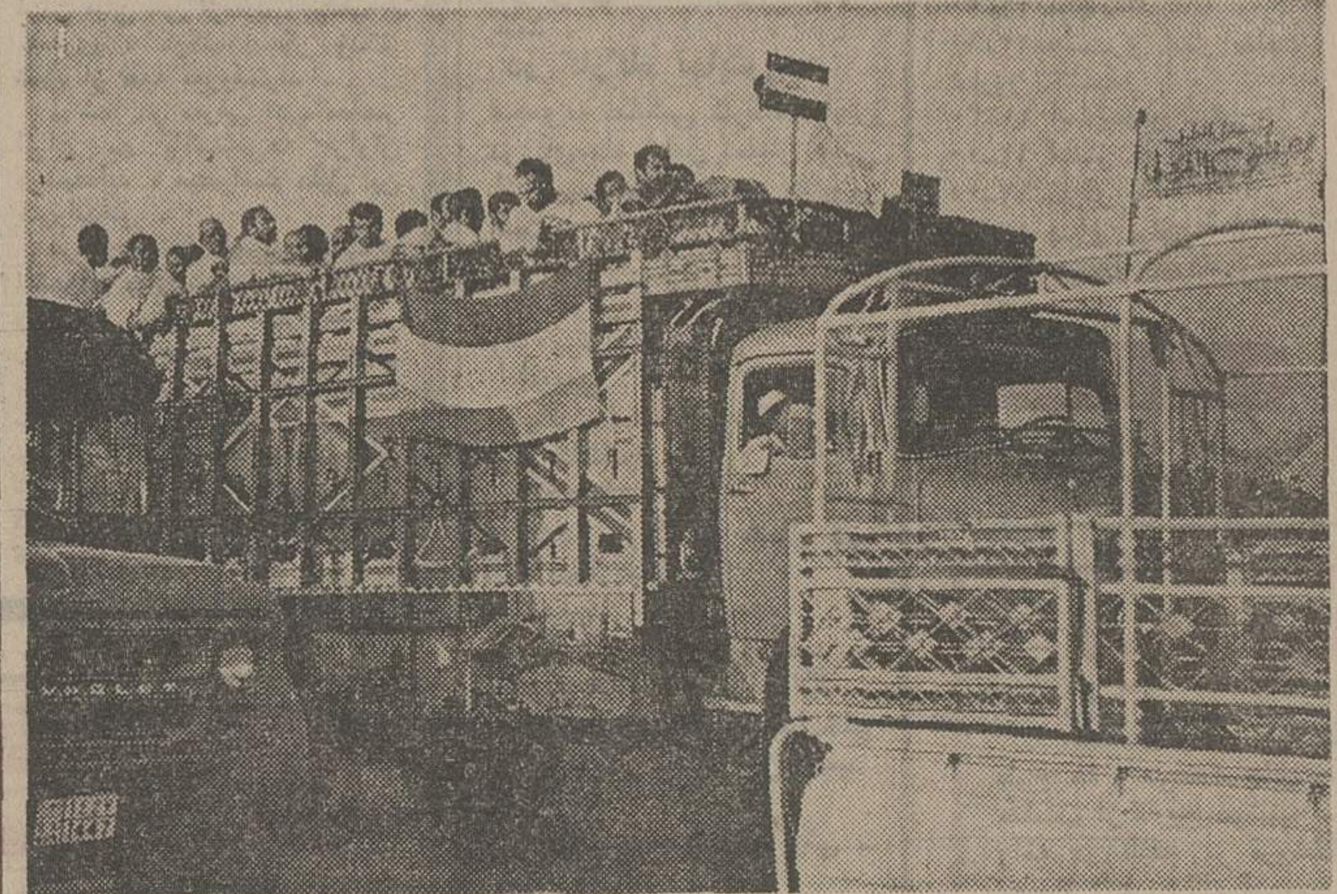
حجاج (برای آن پنجشنبه گروه گروه با اتوبوس و کامیون عازم مکه شدند آنان احرام بسته ، والله الله گویان به سوی خانه خدا در حرکت هستند . . . در عکس گروهی از حاجیان ایرانی که بوسیله یک کامیون از مدینه عازم مکه هستند دیده می شوند .