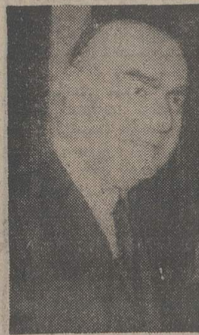
این عکس از دریا سلاز «لوشین بلانکو» نخست وزیر مقول اسپانیا هنگام مذاکرات هفته گذشته او با کی سینجر وزیر خارجه امریکا برداشته شده

شدت انفجار بمب بعدی بود که اتومبیل حامل نخست وزیر به هوا پرتاب شد * یک جوان ۱۹ ساله با تهم قتل نخست وزیر دستگیر شد