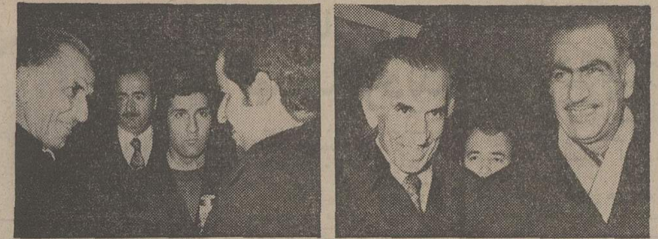
بعد از ظهر دیروز جمشید آموزگار در فرودگاه مهرآباد تقریباً مقیم شده و از وزرای نفت و دارائی اوپک استقبال آنها را به هتل محل اقامتشان همراهی میکند. عکس سمت راست آقای الرافعی وزیر ارتباطات عراق، الطیبه معاون وزیر نفت ابوظبی، درپائین زکی‌یمنی وزیر نفت عربستان سعودی، علی جیده وزیر نفت قطر هنگامیکه مورد استقبال آموزگار قرار گرفته‌اند، دیده میشوند.