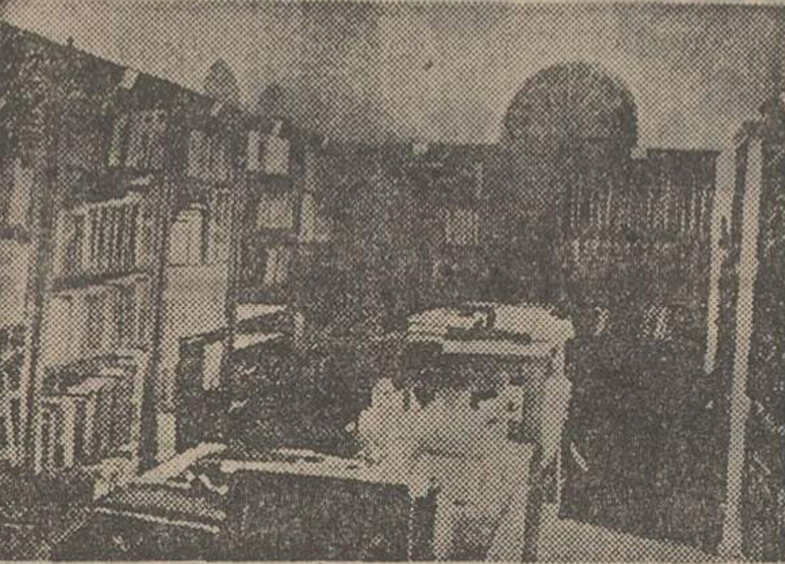
کتابخانه فنی معارف

کلیه قنصولگری های افتخاری ایران در خارجه ملغی شد