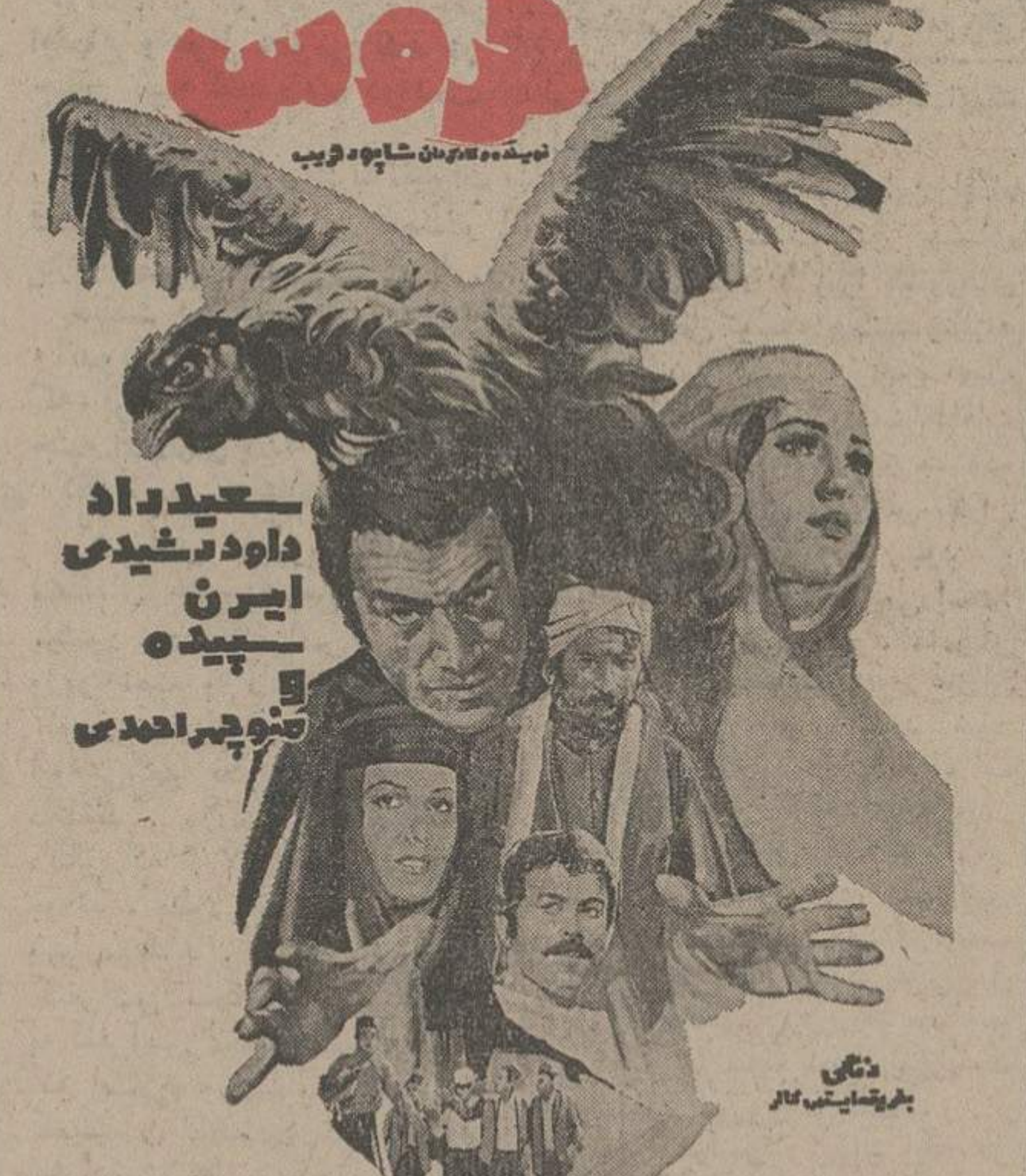
فرمانده گروه ممتاز سینمایی پایتخت