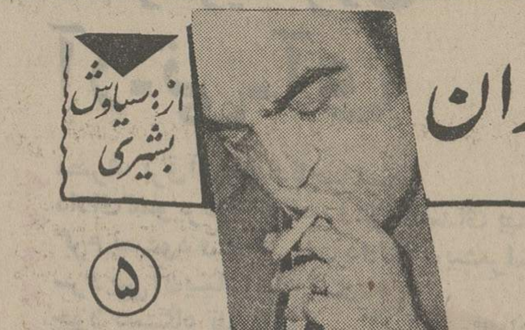
۱۵۰۰۰ کیلومتر سفر به قلب ایران