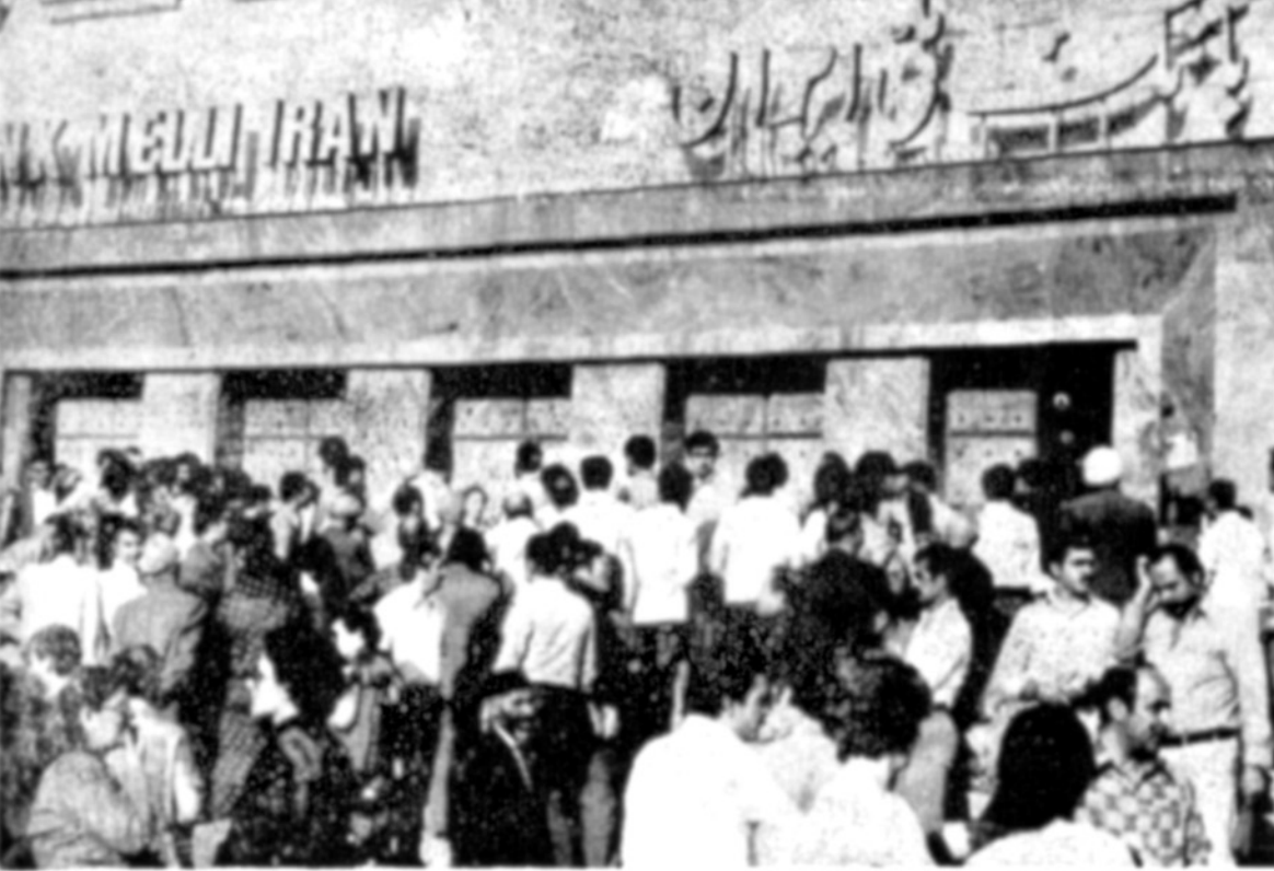
در اولین روز شروع بکار مجدد بانکها پس از چهار روز تعطیل عده زیادی برای انجام امور بانکی مراجعه کردند. در عکس مشتریان در بانک ملی شعبه مرکزی دیده می شود عده مراجعان به بانکهای ملی شده نیز بیشتر از روزهای دیگر بود.