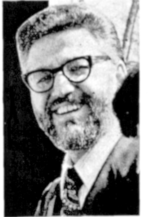
دکتر ابراهیم یزدی وزیر امور خارجه دولت جمهوری اختصاصی با اطلاعات، پیرامون مسائل مملکتی نیز در مصاحبه‌ای - نظرات خود را بیان داشت.

در حالیکه ملت های عرب از انقلاب ایران به وجد آمده اند برخی از کشورهای عرب مثل مصر دشمنی خود را با ما نشان داده اند .