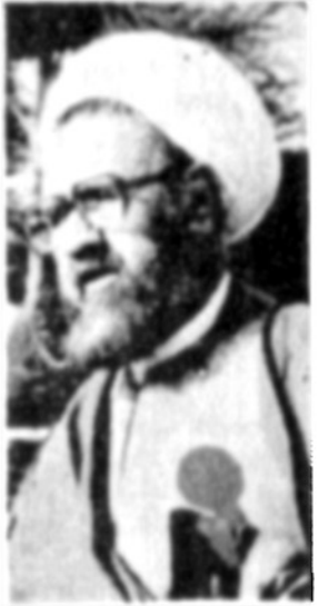
آیت الله مطهری سوء قصد به جان حجت الاسلام رفسنجانی و ترور سپهبد قرنی با ماجرای ترور آیت الله مطهری ارتباطی ندارد