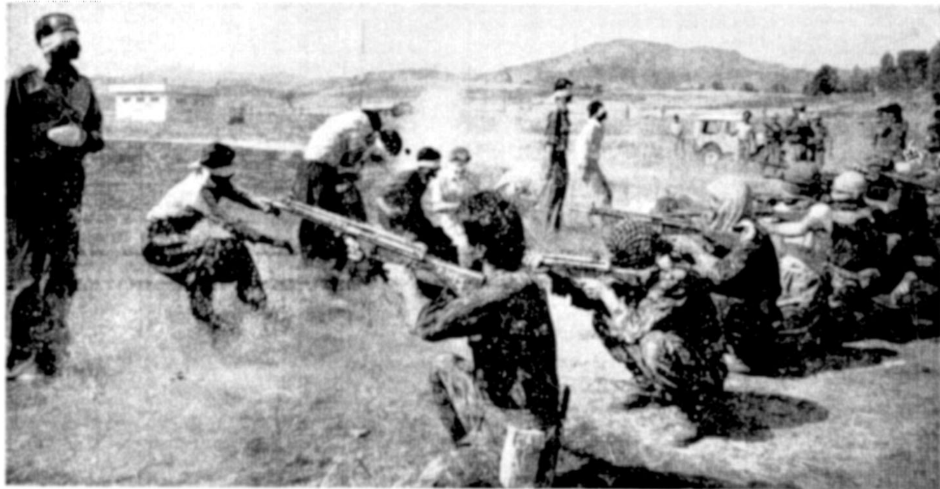
عکسی از لحظه اجرای حکم اعدام گروه یازده نفری در سنندج.